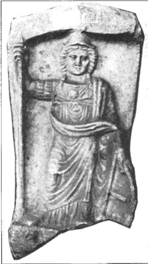
Рис. 6. Мармуровий рельєф із зображенням Афіни. II ст. н. е.

Середземномор'я сюди завозилося також чимало пам'яток мистецтва, які відтворюють високорозвинену естетичну свідомість ольвіополітів, що постійно прагнули познайомитись з досягненнями кращих майстрів Еллади, прикрасити своє місто архітектурним декором та скульптурою (рис. 6). Привізні культові, портретні, декоративні, надгробні пам'ятки були і першими зразками для створення місцевих витворів мистецтва. В жодному з понтійських міст не знайдено такої кількості різноманітної архаїчної мармурової скульптури, виготовленої талановитими мілетськими майстрами, як в Ольвії. Те ж саме можна сказати стосовно поліхромної архітектурної теракоти. В період інтенсивних відносин з Афінами у V—IV ст. до н. е. тут уперше з'явилися монументальні стагуї та надгробні стели з рельєфними зображеннями школи знаменитого Фідія, а також окремі скульптурні твори Скопаса і Праксителя.