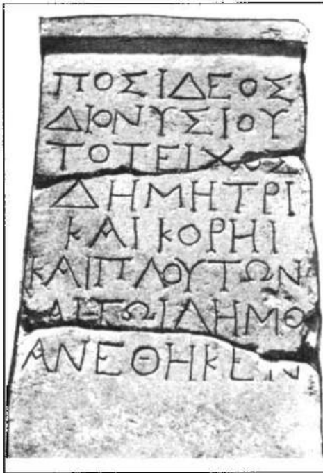
Рис. 9. Кам'яна плита з написом про присвяту оборонної стінки Посідеєм, сином Діонісія, Деметрі, Корі, Плутона і Демосу. II ст. до н. е.

щувалась найбагатша скарбниця з дарами шанувальників із різних міст Середземномор'я і Причорномор'я, яку неодноразово грабували морські пірати як у ті давні часи, так і нові. На Ахіллодромі (сучасна Тендрівська коса) проводили календарно-релігійні свята на честь Ахілла зі спортивними та музично-поетичними агонами, на які з'їжджалися запрошені з різних міст античного світу.