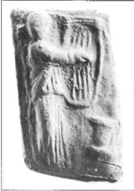
Рис. 4. Терракотовий штамп з зображенням кіфаристи. I ст. н. е.

Традиція заучування напам'ять поем Гомера (або їх уривків) та інших літературних творів, їх коментування існувала в Ольвії з найранішого часу, очевидно, стала нормою культурного розвитку і дійшла до перших століть нашої ери, що насамперед пояснюється надзвичайною популярністю культу Ахілла 34 . Суттєвою складовою освіти в Ольвії, як уже зазначалося, було вивчення філософії та риторики.