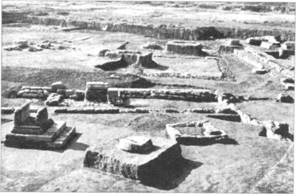
Рис. 1. Західний теменос Ольвії. Будівельні залишки храму Аполлона Іетроса, олтарів, пролілеї, портика. VI—III ст. до н. е.

класичної демократії афінського типу, яка значною мірою стала взірцем для створення сучасної демократії.