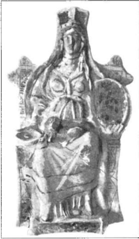
Рис. 8. Теракотова розписна статуетка Матері богів. III ст. до н. е.