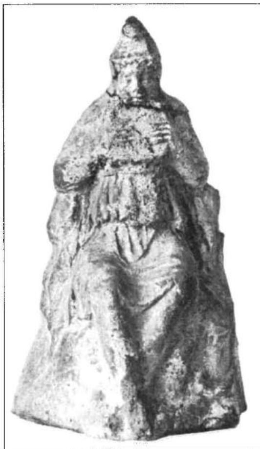
Рис. 5. Теракотова статуетка Аттіса в образі пастуха з сірінгою. III ст. до н. е.

Наявність театру в Ольвії засвідчена лапідарними написами IV—III ст. до н. е. 38 . Окрім вистав тут відбувались і культурно-релігійні заходи та вшанування і нагородження золотими вінками почесних громадян на свята діонісії, тому що найчастіше театр уважався свосереднім святилищем бога Діоніса. Такою ж мірою, як і в інших грецьких містах, театр служив місцем для обнародування найважливіших державних документів і проведення Народних зборів. Його безсумнівне існування разом із багатьма іншими даними підтверджує те, що ольвіополіти захоплювалися музикою, добре знали такі інструменти, як флейта, кіфара, ліра, сірінга (рис. 4; 5). Популярність культу Аполлона і обізнаність ольвіополітів з філософією його релігії, в якій значна увага надавалась його тісному зв'язку з