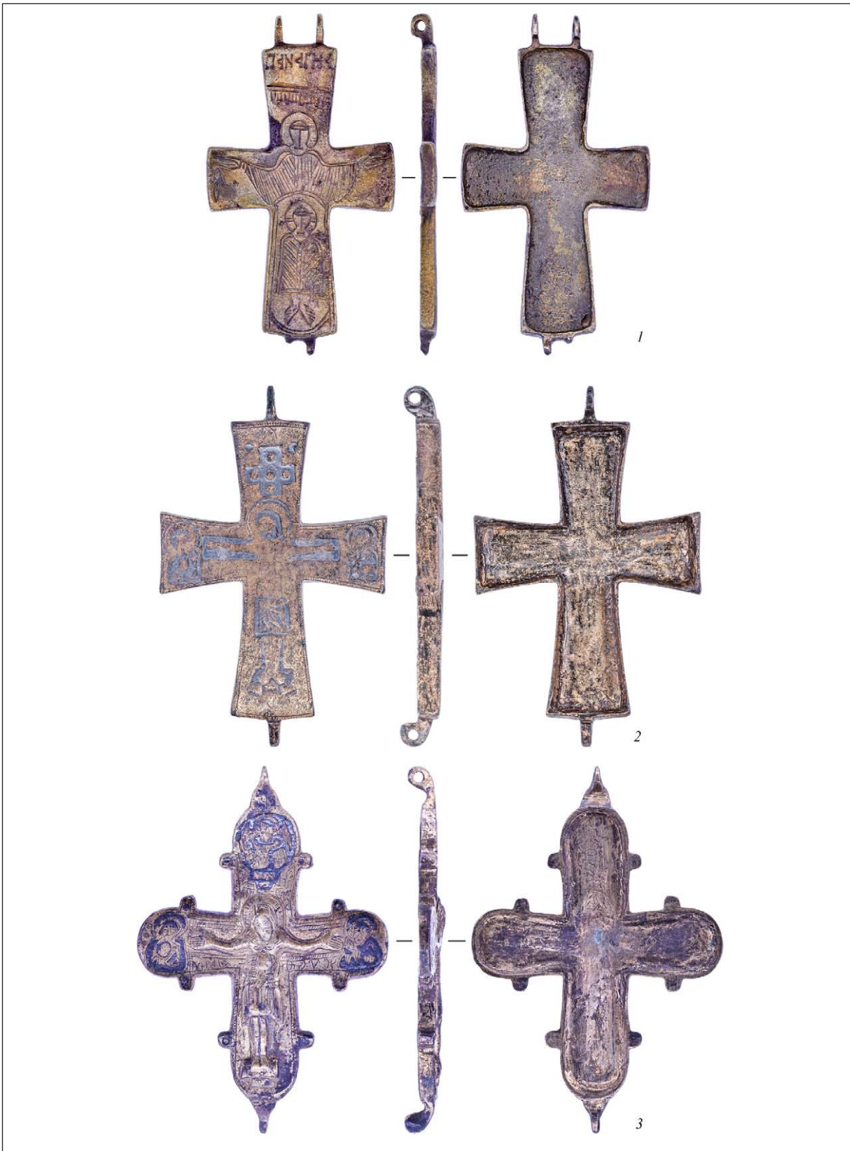
Рис. 2. Ортофотографічні проєкції з 3D-моделей окремих хрестів-енколпіїнів (за інвентарними номерами): 1 — інв. № 5-(5-2); 2 — інв. № 5-(5-153); 3 — інв. № 5-(5-150)