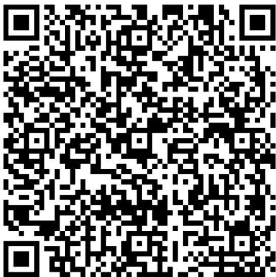
Рис. 1. Онлайн-доступ (QR-код) до цифрового каталога колекції