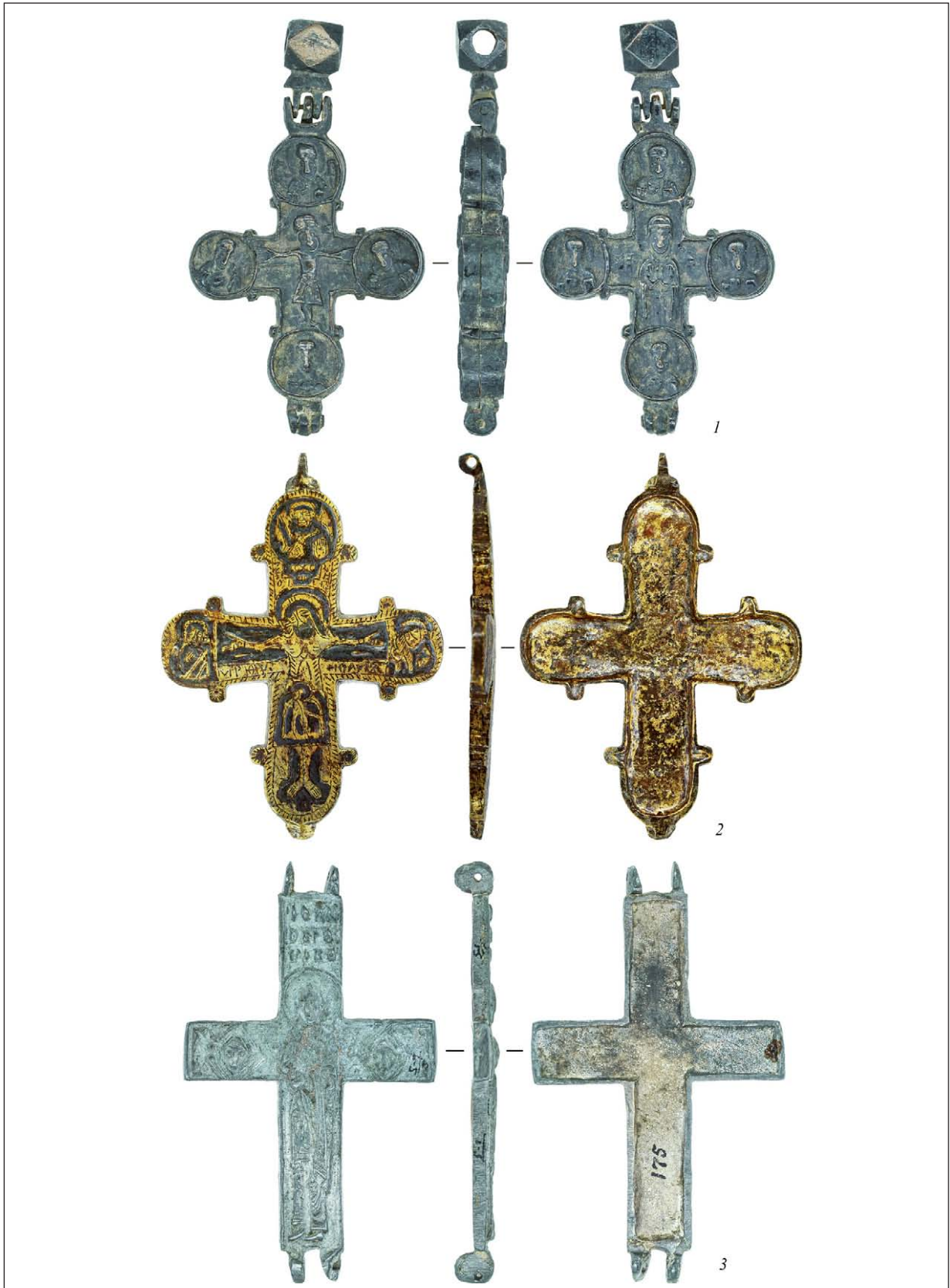
Рис. 3. Ортофотографічні проєкції з 3D-моделей окремих хрестів-енколпіїв (за інвентарними номерами): 1 — інв. № 5-(5-13); 2 — інв. № 5-(5-3); 3 — інв. № 5-(5-4)