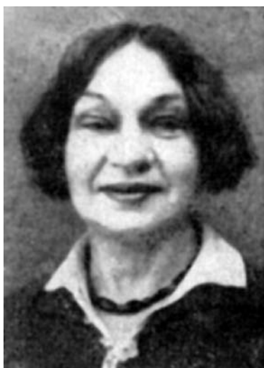
Валерія Євгенівна Козловська (1889—1956)

Співробітники Музею історії міста Києва багато років збирають матеріали, що висвітлюють діяльність археологів, які вивчали давню історію нашого міста. Серед багатьох імен різних поколінь дослідників Києва жінки становлять незначну частину. Діяльність більшості з них припадає на радянські часи, коли жінки почали брати активну участь в усіх галузях науки, техніки та суспільного життя. Відкриває список жінок-археологів в Україні Валерія Євгенівна Козловська, що ще на початку ХХ ст. захопилася справою, якою на той час займалися лише чоловіки.