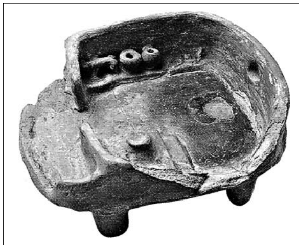
Рис. 2. Глиняна ліпна модель житла. Кінець IV тис. до н. е. Трипільське поселення біля с. Сушківка Черкаської обл. Колекція НМІУ

Так вперше, з уст моєї краціої приятельки, я почула цей вирок» (Полонська-Василенко 1988, с. 121).