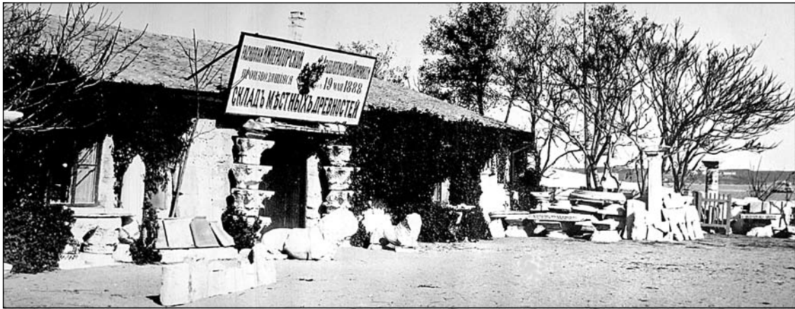
«Склад місцевих старожитностей» Імператорської археологічної комісії.

за винятком найяскравіших артефактів, конкретних місць виявлення знахідок не зазначали, вказували лише район розкопок. Можливо, це пояснюється браком часу, адже самотужки виконати всю роботу з документації знахідок було неможливо. К.К. Косцюшко-Валюжинич міг покластись лише на самого себе. Виготовлення креслень, написання значних за обсягом звітів з малюнками для Імператорської Археологічної комісії — усе це він робив практично сам (іноді йому допомагала донька), коли не займався дослідженнями, веденням розкопок, боротьбою з монастирською владою і військовими будівельниками.