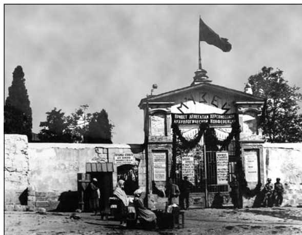
В'їзд на територію Херсонеського музею у дні роботи конференції. 1927 р.