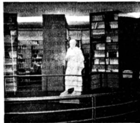
Бібліотека Інституту з вивчення давнини й середньовіччя «Авзоніус» Національного центру наукових досліджень (CNRS) та Університету Бордо-III ім. Мішеля Монтея

антикознавства П. Левека (Париж), який у своєму виступі підбив підсумки триденної роботи, поставили крапку в маленькому, але дуже напруженому й цікавому житті Бордоського конгресу. Певний, що він надовго запам'ятається всім, хто брав у ньому участь, як велике свято міжнародної науки про античність, як форум, де ідеї та думки представників різних національних шкіл були спрямовані на вирішення загальної проблеми —