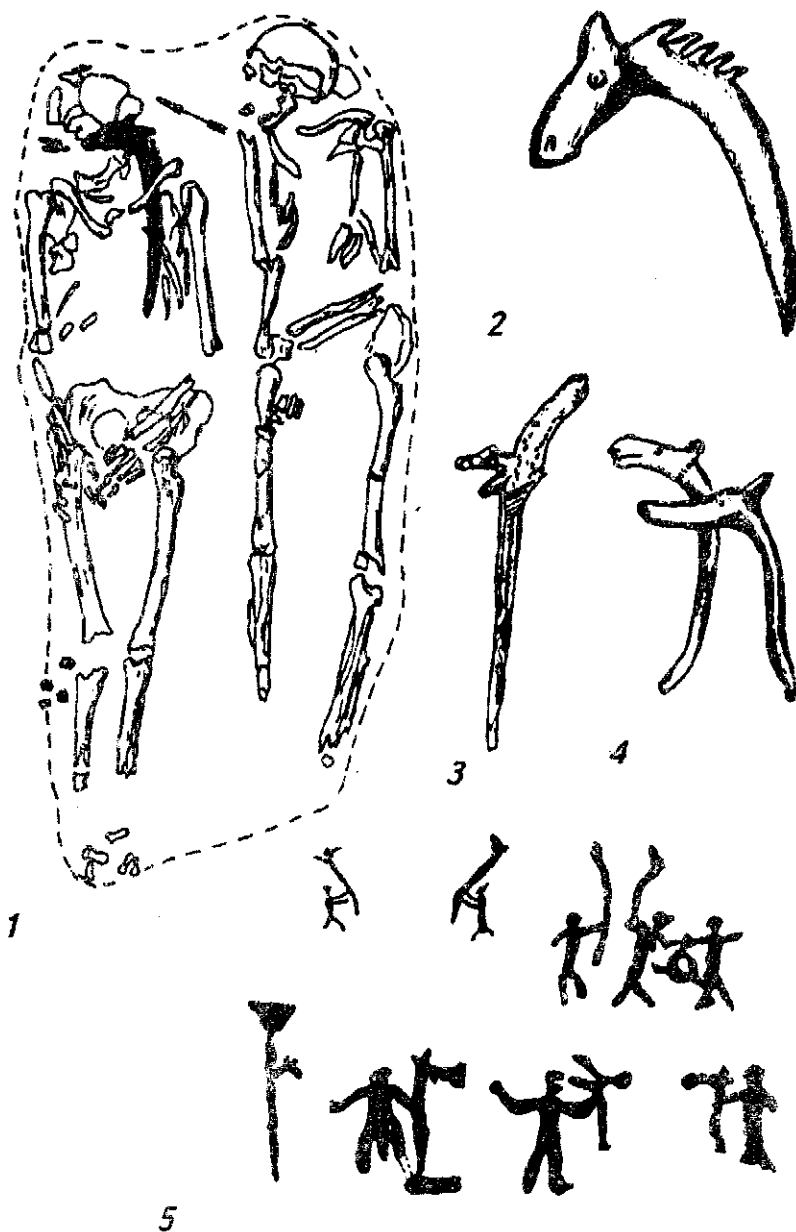
Рис. 2. 1 — поховання «шамана». Оленьчий Острів (Кольський півострів, Росія), 2 — кістяка голена лосихи з поховання «шамана» (Оленьчий Острів, Кольський півострів, Росія), 3 — голова лосихи з поховання (Оленьчий Острів, Баренцево море, Росія), 4 — зооморфні жезли (Прибалтика), 5 — наскальні малюнки із зооморфними жезлами (Скандинавія, Росія).

Поховання з рогами благородного оленя відоме навіть у римсько-британський час. Під курганом діаметром 25 ярдів були знайдені скелети двох людей, покладених на 4 роги благородного оленя. Один з рогів мав залишки черепної кістки, інші — були скинуті 36 .