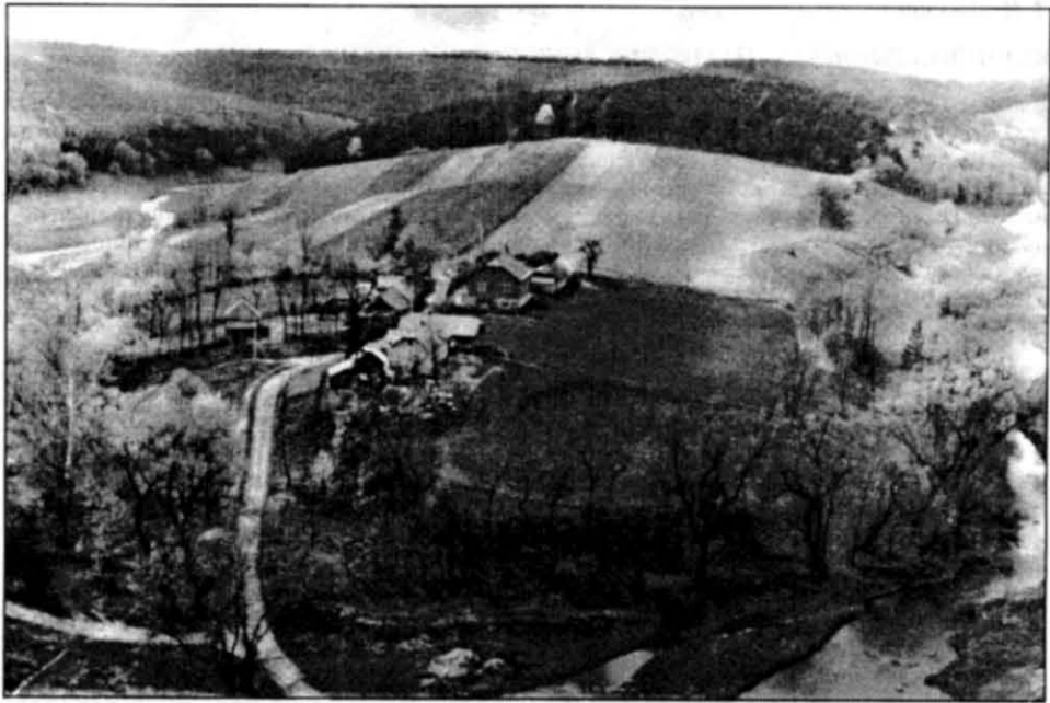
Урочище Обоз зі східної сторони (загальний вигляд). Мис обтікає р. Джурин (ліва притока р. Дністер)