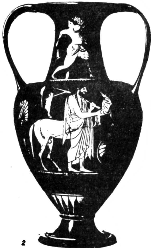
Рис. 3. 1 — фрагмент розпису червонофігурного кіліка, 2 — червонофігурна амфора з зображенням кентавра Хірона та маленького Ахілла.