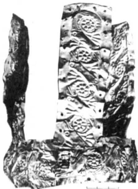
Рис. 2. Золоті платівки-обшивки дерев'яного кубка з с. Оситняжки.

Знахідки дерев'яних чаш зі скіфських поховань досить численні і відомі як в степових, так і в лісостепових пам'ятках. Цілих екземплярів дерев'яного посуду до нас дійшло дуже мало через погану збереженість