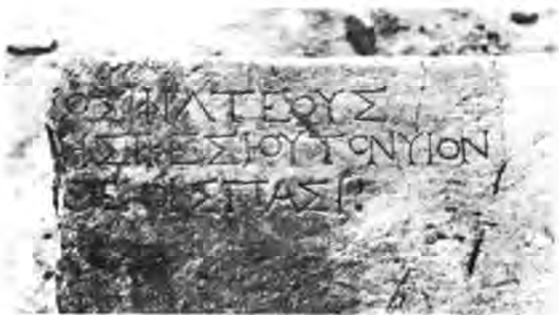
Рис. 11. Постамент з присвятою Всім богам (фрагмент).

36 см від фасаду. За 52 см від правої бокової грані і 20 см від того ж фасаду видобано заглиблення у вигляді ступні (частково збите, розмірами 24,5×5+5,5 см).