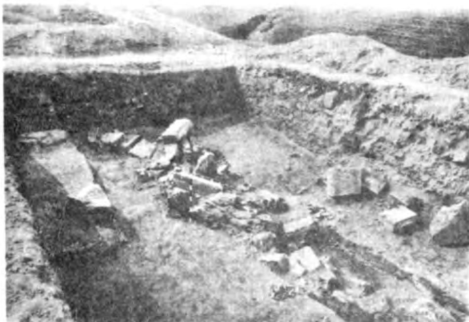
Рис. 1. Південно-східна частина розвалу оборонної стіни та трамбування під башту (ділянка Р-19)