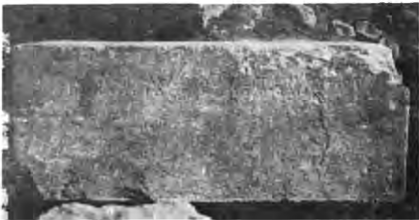
Рис. 9. Постамент з присвятою Зевсу Олімпійському.

Дворядковий напис розмірами 72 × 5 см, вирізаний на лицьовому боці постаменту, зберігся повністю. Незначні пошкодження літер в кінці першого рядка не заважають його прочитанню. Напис розташований на відстані 9—9,5 см від верхнього краю постаменту, за 16 см від лівого і 14 см — від правого. Горизонтальність рядків витримана погано, залишків прокреслених