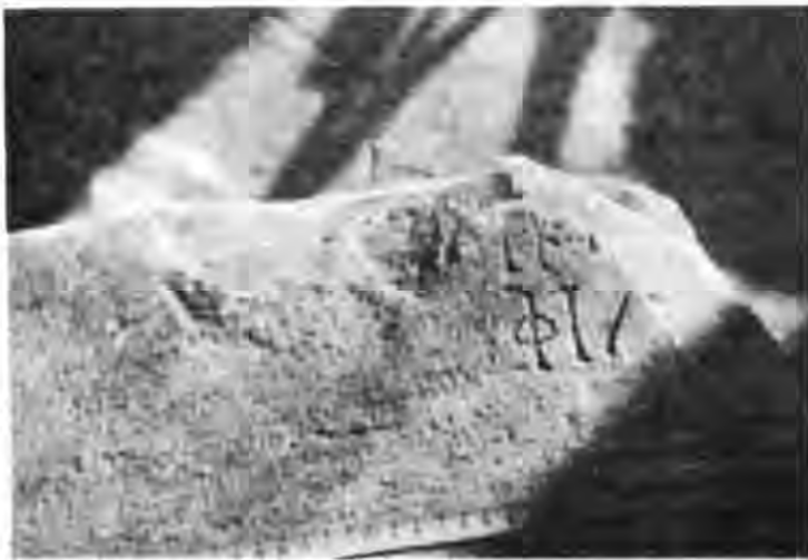
Рис. 12. Постамент з присвятою Всім богам (фрагмент).

Таким чином, розглянуті в комплексі археологічні й епіграфічні пам'ятки, такі неординарні для розміщення їх в оборонній стіні, звичайно, вимага-