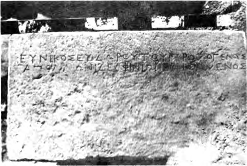
Рис. 10. Постамент з присвятою Аполлону Дельфінію.

3. Постамент прямокутної форми із сірого граніту, оброблений під троянку з усіх боків. Розміри: висота — 32 см, ширина — 73 см, довжина — 71,5 см (рис. 7,3; 10). Фасад і частково бокові грані обкатані по спеціально відміченій лінії, вся верхня площа добре обтесана. На відстані 11 см від правого краю намічена врізною лінією ступня ноги довжиною 29 см, але видовбана тільки частково. За 34 см від неї теж зроблена виїмка типу заглиблення, але попередня розмітка ступні відсутня.