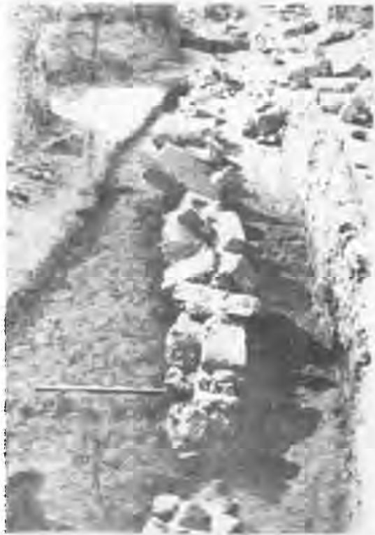
Рис. 5. Розвал оборонної стіни (нижчий рівень, ділянка Р-19)

Особливий інтерес становлять знайдені в цьому розвалі постаменти з написами. Внаслідок того, що кожен з них є самостійною і оригінальною пам'яткою, їх потрібно розглядати окремо, відповідно до методики дослідження лапідарних документів 8 . Попередньо відзначимо, що в розвалі знаходився лише один фрагментований мармуровий постамент розміром 0,70×0,25+0,45×0,46 м без напису. Бокова і верхня площини добре відшлі-