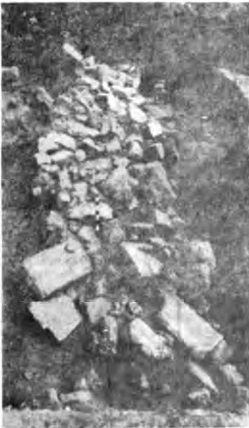
Рис. 4. Розвал оборонної стіни (ділянка Р-19) в основному фрагментами кераміки

Розвал виявлений в жовтоглинистому ґрунті з невеликою кількістю сіроглинистих та золистих включень. Матеріал представлений