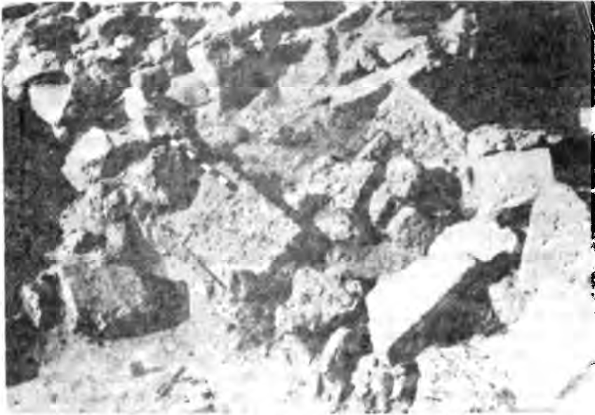
Рис. 3. Центральна частина розвалу оборонної стіни (ділянка Р-19)

Північно-західна частина розвалу (довжиною до 3 м) виявлена повністю, вона розташована з пониженням по схилу II поперечної балки. Перепад висот — 0,60±1,05 м. Камені — в основному дрібний та середній вапняковий