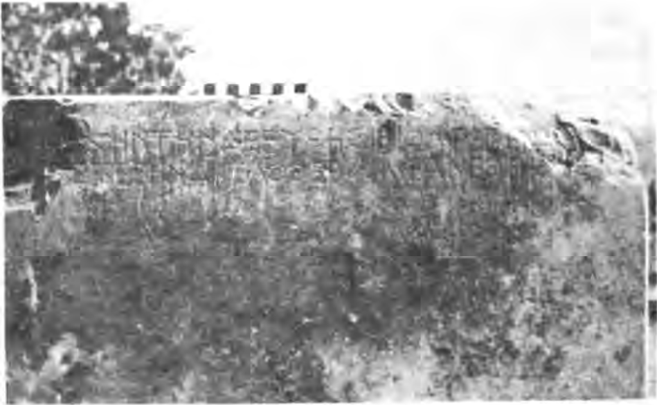
Рис. 8. Постамент з присвятою Зевсу Визволителю.

тільки в плані вивчення культу Зевса в Ольвії, але й взагалі її історії і духовної культури в IV ст. до н. е.