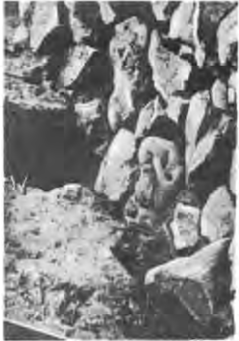
Рис. 4. Фрагмент фотографії з жіночою півпостаттю.

Відгуком на революційні події були його слова в одному з листів до М. Дроздова: «Дякувати Богові, що дозволив мені дожити до цих святкових днів і побачити моїх друзів і Поляків, і Українців, і Росіян вільними громадянами» 6 .