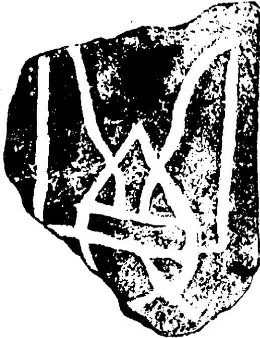
Историческій родовой знакъ на гербѣ Х в., изображенъ въ Дневѣ съ 1907 г.

Геральдическое изслѣдованіе, предназначенное къ чтенію на XIV Археологическомъ Съѣздѣ въ г. Черниговѣ.