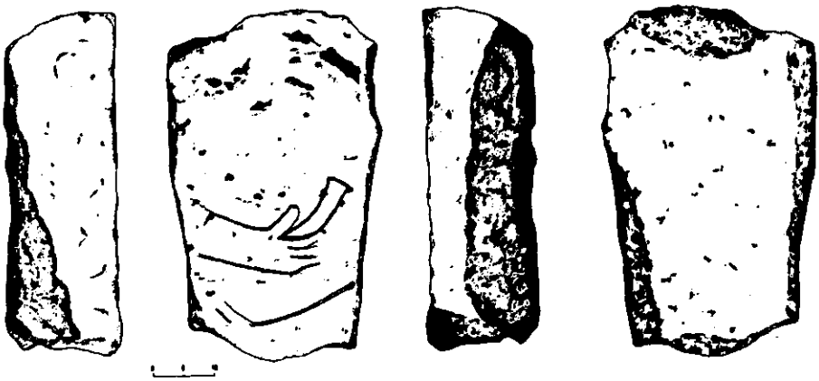
Рис. 3. Статуя в похованні 2 кургану 13

скіфами не пізніше IV ст. до н. е., вірогідніше у VI – V ст. до н. е. Вони більш характерні для території Криму, аніж для північних районів. Так, у степовому Причорномор'ї подібні знахідки трапилися поблизу с. Кам'янка (Республіканець) 5 , с. Червоний Поділ 6 , у Сахновій могилі 7 , тоді як у Криму їх відомо близько шести разом з описаною вище. Донедавна подібні бази у більш східних районах, зокрема у Прикубанні, відомі не були. За оглядом трикутної основи «статуї з вапняку» 8 , знайденої на зруйнованому кургані біля хутора Ковалевського, що зберігається у музеї Палацу піонерів м. Армавіра. Встановлено, що даний фрагмент являє собою уламок бази з прямокутним отвором для встановлення антропоморфа, а не нижньої частини скульптури. Таким чином, звичай використання у ролі закріплюючого елементу кам'яної плити-бази був відомий на значній частині ареалу скіфських антропоморфів. Не відомі такі знахідки за опублікованими матеріалами поки що лише на захід від Південного Бугу та у Подонні-Приазов'ї.