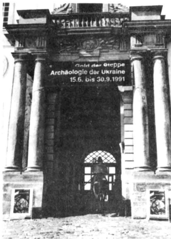
Рис. 1. Портал замку Готторф, де проходила виставка.

робітництва археологів Інституту та їх німецьких колег — рівно за 10 років до відкриття виставки, 15 червня 1981 р., розпочали свою роботу дві спільні експедиції Інституту археології АН України і Німецького науково-дослідного товариства (DFG). Перша з них проводила дослідження слов'янського городища Старигард, яке знаходиться нині майже в центрі невеликого німецького міста Ольденбург у Шлезвіг-Гольштейнії, а друга працювала на півдні України, поблизу м. Нікополя Дніпропетровської обл., де здійснювала розкопки однієї із найвідоміших пам'яток скіфської культури — кургану Чортомлик 1 . Головним результатом цих спільних досліджень стала підготовка двох великих монографій, присвячених Старигарду та Чортомлику, які мають бути надруковані на Україні й у Німеччині 2 . Тоді ж виникла й думка про широку репрезентацію основних досягнень Інституту археології АН