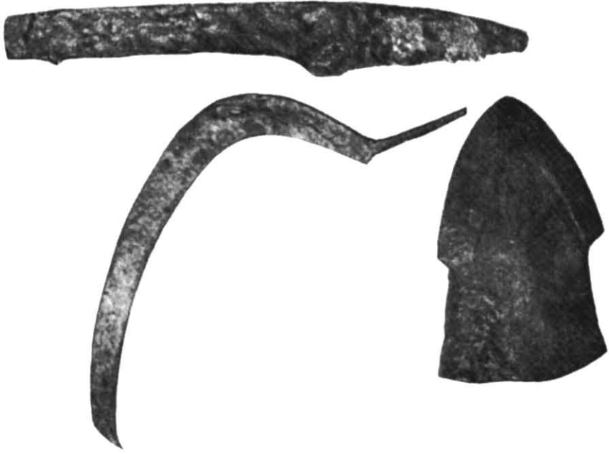
Рис. 3. Сільськогосподарський інвентар (фото).

В заповненні споруди знайдено людські кістки, переважно дитячі. На підлозі, майже в центрі, виявлено три ямки від вертикальних стовпчиків. По всій площі будівлі траплялися ознаки пожежі. Із речових знахідок виявлено фрагменти гончарної давньоруської кераміки, 2 бронзових кільця, риболовний гачок.