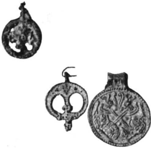
Рис. 4. Ювелірні вироби (фото).

леннях Степового Подніпров'я 8 , а також на поселеннях салтово-маяцької культури 9 . Можливо, опалювальні споруди на Дівич Горі залишені вихідцями із степових районів Подніпров'я чи Подоння. На тісні зв'язки з кочівниками вказують знахідки бронзових казанів, зеркал, срібних сережок половецького типу. На площі городища розкопано велику кількість (23) господарчих ям, що значно перевищує їх наявність на інших пунктах. Значне число предметів озброєння вказує на перебування тут постійного гарнізону. А знахідки хороса, хрестів, енколпіїнів свідчать, що Сахнівське городище було одним з центрів поширення державної релігії (рис 6).