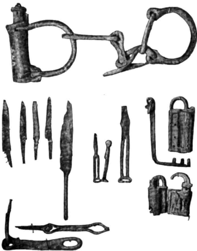
Рис. 1. Залізні вироби (фото).

на глибині 1,4 м стояли два встановлені один в один казани з листової міді, з проваленими денцями. Біля казанів лежав енкалпйон з гранчастим вушком і рельєфним зображенням.