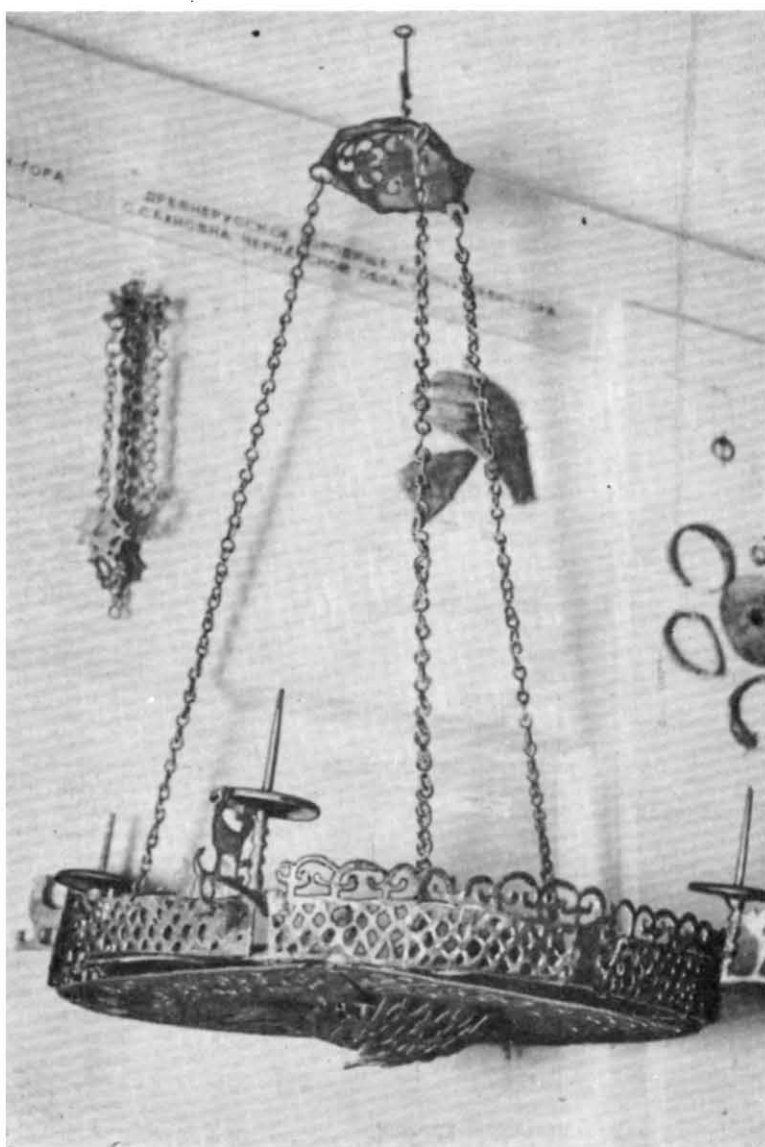
Рис. 6. Хорос (фото).

лишки церкви, терема, численні господарчі ями і приміщення. Ці матеріали дозволяють і Сахнівське городище тлумачити як князівське сільце — загородню резиденцію пороських правителів, які призначалися з Києва 15 (таблиця).