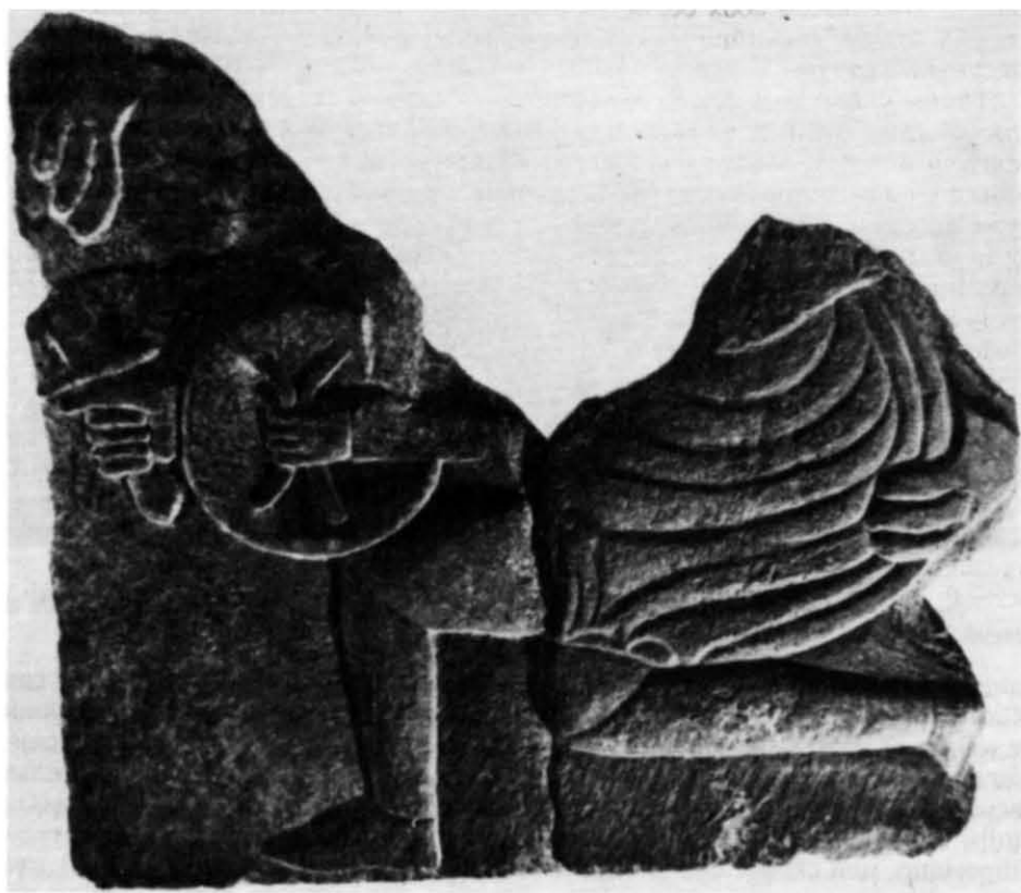
Рис. 8. Фрагмент рельєфу з зображенням озброєного воїна в боротьбі з левом (Національний музей історії України).

лягання до Іоано-Предтечинської хрещальні була зруйнована до підвалин вибухом собора, зараз неможливо простежити, якою мірою її торкнулися ремонтні роботи XVII ст. 37 . Додам, що після землетрусу 1230 р. кладка стін собору була перекладена з стародавньої цегли, яку брали з розвалу кладок XI ст., причому, за зауваженням М. В. Холостенка, у заповненні такої кладки південної стіни поряд з «валунами, шматками рожевого розчину, уламками шиферних плит» зустрічалися й різьблені 38 . Стилістична схожість рельєфу даного фрагменту з різьбленням плит зі стіни друкарні собору дозволяє датувати його кінцем XI—XII ст.