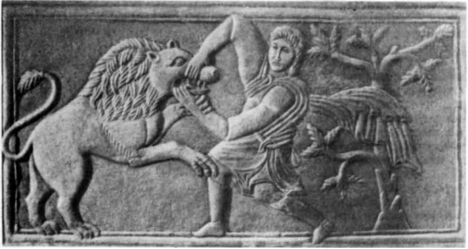
Рис. 5. Рельєф із зображенням Самсона, який бореться з левом (Кисво-Печерський державний історико-культурний заповідник).

рельєфна вузька смужка — ймовірно, ошийник. Праве кінцало збереглося гірше. Воно розташоване паралельно спині, значно виступаючи перед шиєю. Незважаючи на те, що рельєф погано зберігся, видно, що він був досить високий та виступав майже під прямим кутом до тла, на якому чітко видно сліди різця. Зараз пам'ятка готується до публікації. В. Г. Пуцко, який відзначає його типологічну близькість до мармурового рельєфу XI ст. з Фесалонік та схожість прийомів обробки з різьбленням шиферних рельєфів із святими вершниками, вважає, що як і вони, ця плита була пов'язана з собором Дмитрівського монастиря 30 . Проте, враховуючи сказане про «михайлівські» рельєфи, ця думка уявляється неправильною.