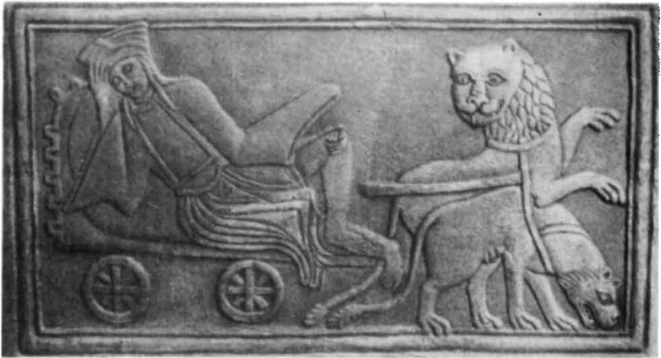
Рис. 6. Рельєф із зображенням Кібели, яка їде у візку, запряженому левами (Києво-Печерський державний історико-культурний заповідник).

висловлену свого часу точку зору про те, що на рельєфах зображено саме Самсона та Кібелу та дійти висновку, що жіночий образ, прототипом якого є зображення Кібели, яка їде у візку, закладеному левом та левицею, сходить до одного з типів іконографії Кібели римського часу в образі покровительки всього живого (дикі леви — царі звірів покірно прислужують їй) та захисниці міст (високий вінць, стінка візка у вигляді зубців міського муру). Вірогідно, цей сюжет був запозичений з візантійських (малоазійських) джерел, до яких, до речі, дослідники відносять походження цього образу, розглядаючи його і як Діоніса. Так, за С. Радойчичем, до Києва він потрапив через Солунь та Святу Гору. Час появи цих рельєфів він відносить до XI—XII ст. 34 Стилістичні ознаки та особливості вбрання жіночого персонажу, на мій погляд, дозволяють датувати їх кінцем XI—XII ст. 35