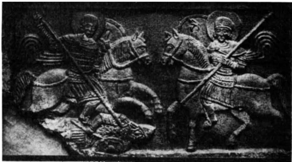
Рис. 3. Рельєф із зображенням св. Дмитра Солунського і св. Георгія або св. Нестора (Третьяковська галерея).

візантійський прототип зображення. Плита зі св. Георгієм та Федором з «Софійського музею» виконана менш майстерно, зображення тут носить умовніший характер та має відчутні риси середньовічного мистецтва (рис. 2).