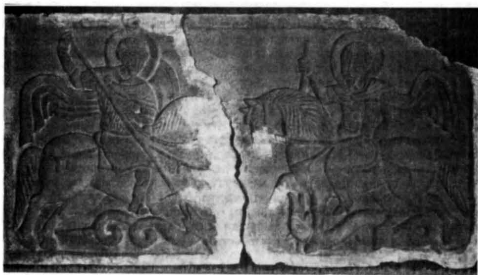
Рис. 2. Рельєф із зображенням св. Георгія і св. Федора Стратилата (Національний заповідник «Софія Київська»).

Обидва рельєфи в різні часи було знайдено на території Михайлівського Золотоверхого монастиря й наприкінці XIX ст. вміщено на зовнішню стіну Михайлівського собору. Вважалося, що частина місце знахідки цих плит тепер не можуть бути встановлені 4 . Однак, про одну з них (рис. 2) відомо, що її було знайдено 1785 р. під