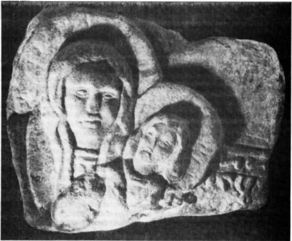
Рис. 10. Фрагмент рельєфу з зображенням Богоматері Однітрії (Національний музей історії України).

тійською архітектурною системою і знайшов прояв саме в застосуванні окремих елементів романського декору — архітектурних поясків та деталей білокам'яного різьблення. І хоча в Києві ці елементи використовувалися дуже обмежено, повної відмови від пластичного декору, ймовірно, статися не мог-