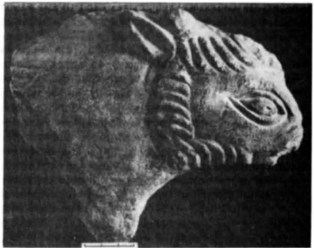
Рис. 7. Фрагмент рельєфу з зображенням голови тварини (цапа ?) (Києво-Печерський державний історико-культурний заповідник).

В. О. Харламов залучає до цього ж циклу рельєфів фрагмент (20×16 см) плити з зображенням голови тварини, яку він визначає як цапа (рис. 7). Фрагмент знайдено 1971 р. у північній частині стародавнього нартексу Успенського собору в кладці стіни біля Іоано-Предтечинської хрещальні. На думку дослідника, ця плита разом з плитами з друкарні входила до циклу плит з сюжетними язичницькими композиціями, виготовленими за античними зразками, що прикрашали палац князя Володимир у Берестові до прийняття ним християнства. Після цієї події з усіх плит були залишені лише ті, зображення на яких можна було тлумачити з позиції новоприйнятої релігії 36 . Думка ця не одержала підтримки дослідників. В. Г. Пуцко зазначає, що, оскільки північна стіна нартекса в місці її при-