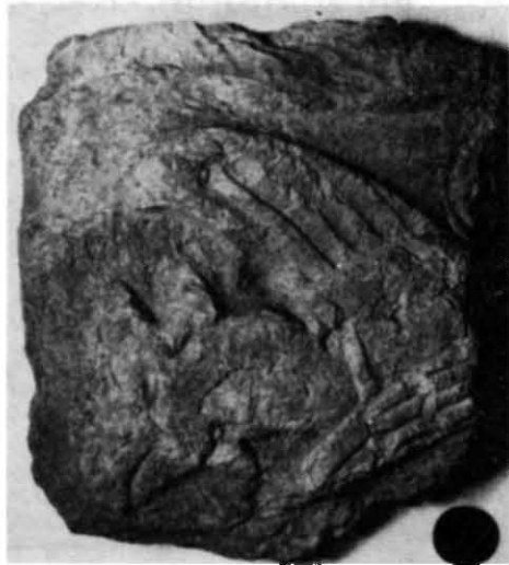
Рис. 4. Фрагмент рельєфу з зображенням грифона (Музей історії міста Києва).

На території Михайлівського Золотоверхого монастиря серед шиферних плит, використаних як будівельний матеріал у трапезній церкві Іоана Богослова, нещодавно В. П. Шевченко було знайдено ще один фрагмент (45×53 см) шиферної плити з дуже пошкодженим рельєфним зображенням грифона (рис. 4). Верхня частина плити має рамку (збереглася частково) у вигляді простого гладенького бортика. Впритул до неї, під гострим кутом, розташоване ліве підняте крило грифона, заокруглене на кінці. Його голова з горбатим дзьобом та борідкою трохи схилена, на шиї (поміж крилами)