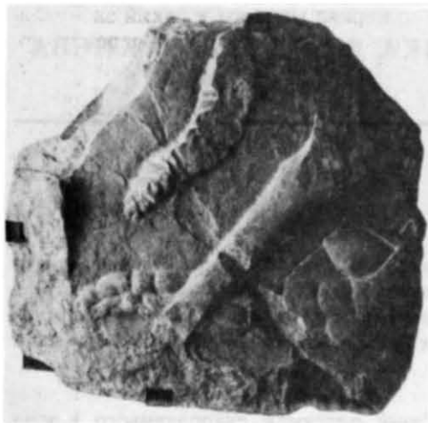
Рис. 1. Фрагмент рельєфу з зображенням зміборця з тимпану північного portalу Успенського собору Києво-Печерської лаври (Києво-Печерський державний історико-культурний заповідник).

час будівництва кам'яної огорожі Михайлівського монастиря, коли було відкрито підвалини кількох кам'яних церков 5 . За словами Л. Похилевича, в землі при фундаментах кам'яної великої церкви, розташованої на північній схід від Михайлівського собору, було «вмуровано у стіну зображення муч. Тирона на коні, зроблене рельєфом на камені художником, мало вправним» 6 . Руїни цього храму (ймовірно, виходячи зі змісту рельєфу та персоналізації одного з персонажів як св. Федора Тирона) ототожнювалися з рештками Федорова вотча монастиря 7 . Але тому, що, можливо, будь-яких інших аргументів на користь цієї гіпотези не було, згодом її визнали безпідставною, а руїни храму на північній схід від Михайлівського собору стали розглядати як Дмитрівський собор 8 .