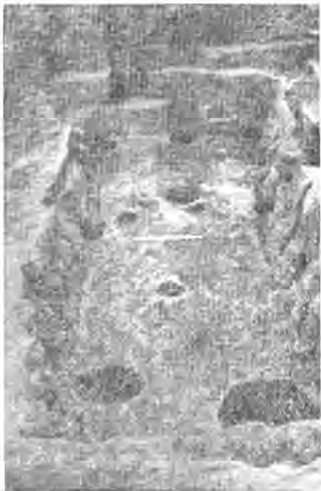
Рис. 1. Будівельний комплекс № XVIII «лавка ювеліра».

Датуючий матеріал дозволяє віднести будівельний комплекс XVIII до середини IV ст. до н. е. Таким чином, ця споруда — одна з ранніх серед відкритих на Єлизаветівському городищі. За конструктивними