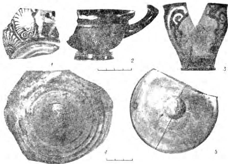
Рис. 3. Керамічні знахідки в «лавці ювеліра»:

1 — фрагмент червонофігурного кіліка; 2 — чорнолаковий глибокий кілік; 3 — червонофігурний скіфос; 4 — кришка світлоглиняної леканіди; 5 — червоноглиняне рибне блюдо.