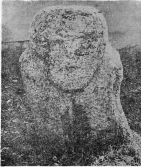
Рис. 1. Кам'яна статуя з с. Великомихайлівка.

Статуя являє собою жіночу стелоподібну поясну скульптуру, виготовлену з рожевого із сіруватим відтінком грубозернистого граніту.