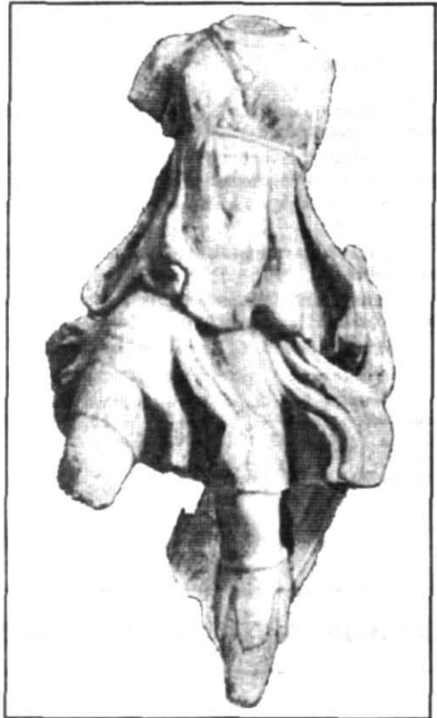
Рис. 2. Мармурова статуя Артеміді.

Аналогічної теракотової статуетки в античних містах Північного Причорномор'я немає. Навіть у Херсонесі Таврійському, де Артеміда Партенос була головною покровителькою держави, дещо схоже її зображення (Діва, що стоїть у довгому хітоні, тримає в лівій руці лук, у правій — спис) є тільки на монетах I ст. до н. е.— I ст. н. е. Не знайдено і в Ольвії теракот подібного типу. Цілоком можливо, що з розглядуваної форми було зроблено лише кілька відбитків, бо їх професійне виготовлення можна вважати нелегким з двох причин: доробка частин фігури, яких не вистачає та нехарактерні для