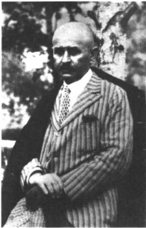
Рис. 3. Вадим Михайлович Шербаківський (1876—1957). Фото 1943 р. Публікується вперше.

Новгорода у 9-му випуску праць комісії 34 .