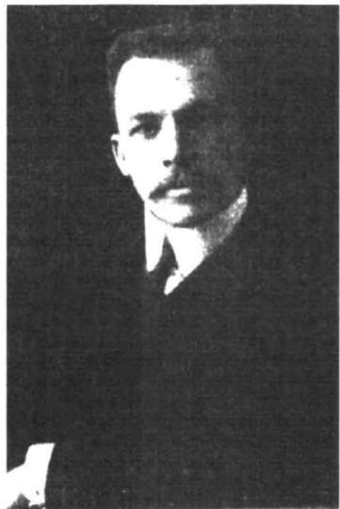
Рис. 2. Микола Омелянович Макаренко (1877—1933). Фото 1910 р. С.-Петербург.