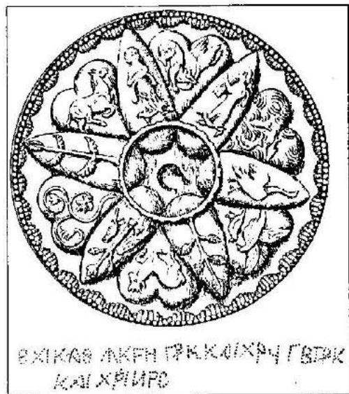
Рис. 5. Малюнок зовнішньої сторони сасанідської фруктовниці з Малоперещенинського «скарбу», до статті І. А. Зарещького. Мал. Г. О. Коваленка. ПВАК (1912 р.).

Комісія започаткувала публікацію результатів археологічного картографування краю у вигляді описів курганів та майданів Лохвиччини в Посудлі 56 , далі — окремих об'єктів Полтавщини взагалі 57 , а згодом — і зводів з детальним аналізом видів пам'яток та описом їх місцезнаходження, публікацією планів та схем розташування 58 . Видання першого зводу городищ, курганів і майданів Полтавщини за даними анкетування Центрального Статистичного Ко-