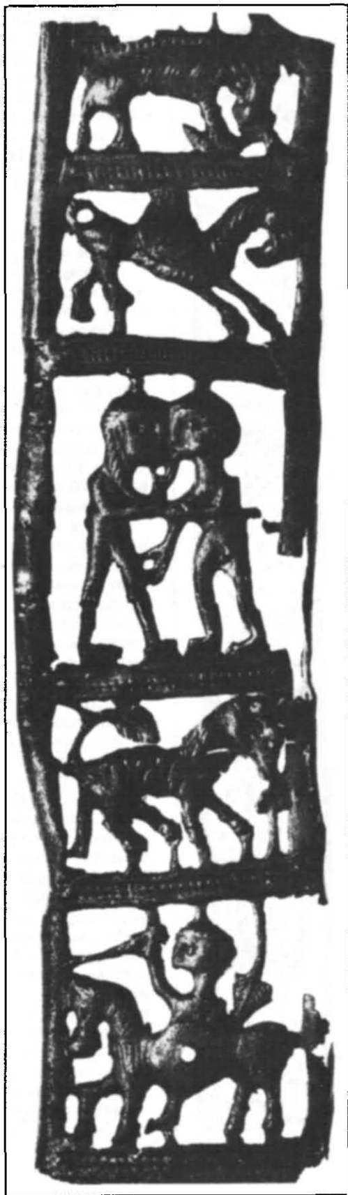
Рис. 1. Обкладка піхов меча з могильника пшеворської культури поблизу с. Гринів (Верхнє Подністров'я).

Образ Грифона має безліч функцій. Але на першому місці завжди виступає його природа хижака і зв'язок з небом. Він постає як істота, присвячена сонцю, втілення вогняного початку, пов'язаного з перебудовою всесвіту, з космогенезом 6 .