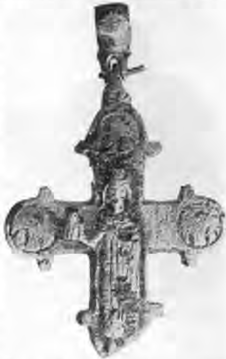
Рис. 1. Стулка хреста-енколпіона з зображенням Гліба. Бронза.

ті — воїни. Не виключено, що ця остання «функція» святих князів залишилась провідною і пізніше, з XII ст. навіть посилилася, коли руські землі, особливо Київська, більш ніж будь-коли потребували захисту. Зображення Бориса і Гліба з подвійними атрибутами виконувалися і пізніше. Як приклад можна навести бронзову іконку із розкопок у Кописі (БРСР), знайдену в давньоруському шарі 14 , висотою без провуха 10,3 см. На ній зображені у зріст дві чоловічі фігури у майже однакових поставах і в багатому одязі, на головах високі шапки з опушкою. Їх одяг довгий, витонченого крою. У обох в правій руці хрест, друга тримає ручку меча, підвішеного зліва до пояса. Обличчя їх видовжені, волосся довге. Фігура справа без бороди, ліва з вусами і невеликою бородою. Обрамлення, тло, позем, написи відсутні. Навколо голів — німби. Верхні частини голів з'єднані широкою перемичкою з вузьким виступом зверху, на звороті якої зроблено штифт. На шапках та одязі — вертикальні складки, які певною мірою передують поширенню цього засобу зображення у післямонгольські часи. Відсутність обрамлення і тла також передують появі в XIV ст. скульптури з такими якостями. Зокрема, яскравим прикладом її може бути фігура Миколи Можайського 15 . Не підлягає сумніву, що на образкові з Кописі зображені Борис і Гліб. З певною мірою умовності ікона може бути датована кінцем XII — початком XIII ст.