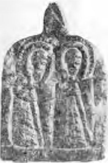
Рис. 2. Іконка з зображенням піших Бориса і Гліба. Шифер.

Лінія розвитку культу Бориса і Гліба, запропонована В. І. Лесючевським, була продовжена і розвинена М. Х. Алешковським 20 . Він вважає, що на початку найбільше шанувався Гліб як патрон Святослава Київського (1073—1077), а через це культ цілком був глібоборисівським.