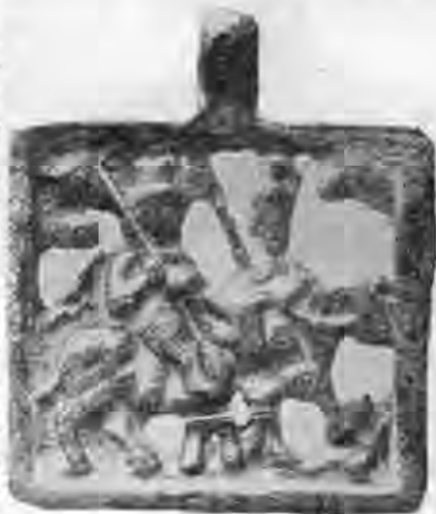
Рис. 3. Іконка з зображенням кінних Бориса і Гліба. Бронза.

За літературними джерелами 25 відома дуже подібна до наведеної вище також квадратна (5,75×5,75 см) іконка, знайдена в уроч. Городисько, поблизу с. Гаряченці, містечка Калюс Ушицького повіту Подольської губернії. Її передали до музею Подільського церковного історико-археологічного товариства 1890 р. з бібліотеки Подільської духовної семінарії, куди вона прибула невдовзі після її знахідки. Дослідники відзначали, що зображення на ній виявляє близьку схожість з рисунком у рукопису XIII ст., який опублікував М. Максимович 26 . В дореволюційних виданнях ця пам'ятка датується XIII—XIV ст. На відміну від розглянутого вище, вона відлита з міді, що вказує на післямонгольський час виготовлення. Порівняння бронзового варіанту з рисунком у «Киевлянині» дає підставу вважати про надто близьку подібність обох іконок (бронзової і мідної). Не виключена можливість, що у них спільна модель. Їх обрамлення має форму квадрата.