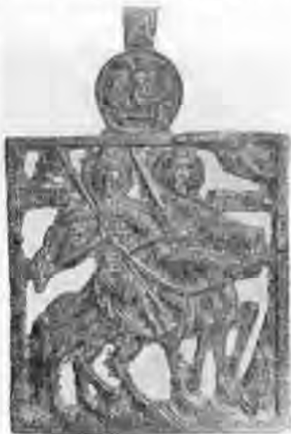
Рис. 7. Іконка з зображенням кінних Бориса і Гліба. Мідь.

ням «Нерукотворного Спаса» та обрамленням вміщується зображення «старозавітної Трійці». Іконки з таким доповненням відомі в двох варіантах. В першому зображення «Трійці» майстерно вкомпоноване в коло 48 (рис. 7), у другому воно вміщене в прямокутник з заокругленими верхніми кутами 49 . Вміщення цього сюжету вірогідно було зв'язане з підвищеним шануванням його в XVI ст. та у подальші часи. Перший із згаданих варіантів виник на південноруських землях, і зображення «Трійці» в колі є точною копією круглого срібного образка XVI ст., який виявлено у Каневі на Київщині 50 . Три ангели, зображені на ньому, — приземкуваті фігури з великими головками, в яких ще помітно відчувається так звана туга романська форма. Проте велика увага до деталей зображення, зокрема трактування зачісок, вказує на значний вплив візантійських традицій, які в південноруських землях утримувались довше і міцніше, ніж у північноруських. Срібний образок XVI ст. двосторонній: на протилежній його стороні є зображення «Розп'яття з предстоячими», якого не відтворено на іконці з Борисом і Глібом. Другий варіант завершення був виконаний, очевидно, в північноруських землях. Форма завершення, можливо, була запозичена з якогось більш давнього зразка дрібної пластики. Перший варіант відомий у двох примірниках 51 ; другий — в одному. Розглянуті іконки з зображенням Бориса і Гліба не мають на зворотній стороні слідів від будь-якої обробки, що вказує на час їх виготовлення — до XVII ст. 52