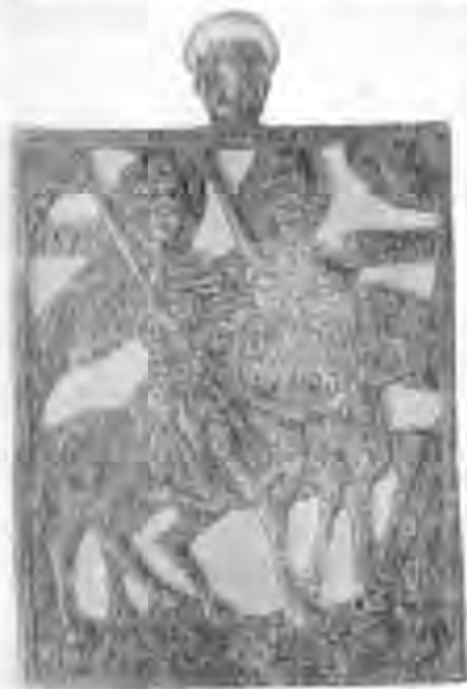
Рис. 8. Іконка з зображенням кінних Бориса і Гліба. Мідь.

ки цьому весь твір наповнюється новим змістом і сприймається по-іншому. Спорядження і озброєння святих-воїнів начебто таке саме, що і в ранніших подібних іконках, але в той же час характер його та елементи композиції, завдяки іншому пластичному виконанню, також інші. Все тепер виглядає більш просто, відзначається значно меншою витонченістю, рафінованістю. У своєрідній декоративності і простоті, у підвищеній виразності помітно відчувається вплив народного мистецтва. Але особливо характерні обличчя святих-князів. Вони