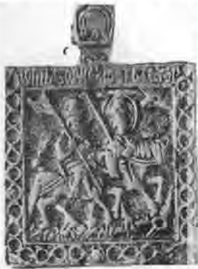
Рис. 4. Іконка з зображенням кінних Бориса і Гліба. Мідь.

і ранніми післямонгольськими зразками. Вільне, невимушене пластичне рішення рельєфа, з використанням лінійно-дугувих засобів пластичної виразності, не виявляє великої уваги до деталей зображення. У даному випадку своєрідно сполучаються пластична виразність з декоративністю, що можна спостерігати і на українських кахлях XV—XVII ст. Такі риси, безсумнівно, ідуть від народного мистецтва. З другого боку, манеру виконання рельєфу можна розв'язати з пластичним трактуванням зображень на срібній обкладинці Галицького євангелія XIV ст. 35 І в першій, і в другій пам'ятці простежується своєрідність художніх засобів перекладу зображень на мову металопластики, обумовлену технікою виконання: іконки — литтям, обкладинки євангелія — карбуванням.