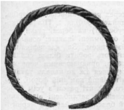
Рис. 2. Псевдовитий браслет.

Довжина розгорнутого наруччя повинна дорівнювати 19,5 см, що відповідає діаметру 6,2 см. Вздовж середньої смуги кожної стулки є по три петлі шириною 0,25 см. З них дві крайні розміщені на відстані 1,2 см від бічної облямівки. Третя — посередині між ними, на віддалі по 2,2 см з обох боків. В кожній петлі було по круглому рухомому колечку з діаметром зовнішнім — 1,3 см і внутрішнім — 0,7 см. Колечко в перерізі теж кругле (діаметр 0,3 см). На браслеті збереглося тільки одне з них. Проміжки середньої смуги, між петлями, орнаментовані заглибленим карбуванням. Орнамент простий, геометричний, у вигляді трикутників, з'єднаних вершинами, ламаних ліній та круглих крапок (можливо, він символізує зорану землю та краплі грозового дощу).