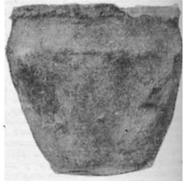
Рис. 3. Посудина з поховання № 1 (курган № 2).

Розкопками курганів поблизу с. Костянтинівка розпочалося археологічне вивчення Пологівського району, який залишався до останнього часу «білою плямою» на археологічній карті Запорізької області.