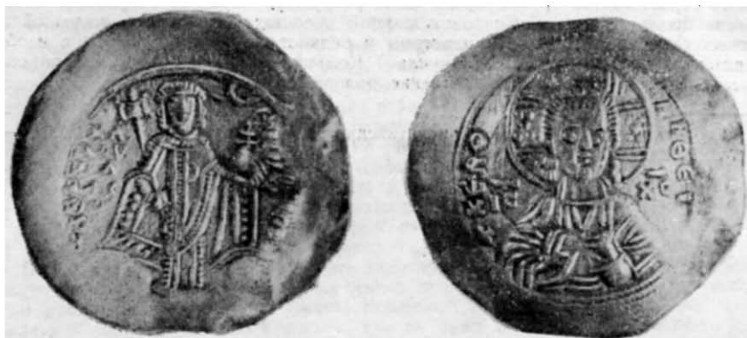
Рис. 3. Золота монета Мануїла I Комніна (зворотний і лицьовий бік).

Саме поховання майже цілком знищене траншеєю. Вдалося простежити лише сліди поховальної ями, де в південно-східному кутку збереглися залишки зотлілих