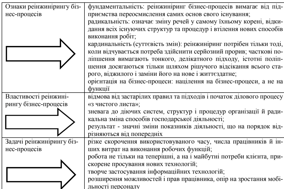
Рис. 2. Ознаки, властивості та задачі реінжинірингу бізнес-процесів

Реінжиніринг – це, по суті, заміна старих методів управління на нові, більш сучасні, і на цій основі істотно поліпшення показників ефективності (рис. 2).