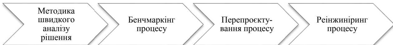
Рис. 1. Підходи до покращення бізнес-процесів на підприємстві

Концепція покращення бізнес-процесів ґрунтується на чотирьох підходах (рис. 1).