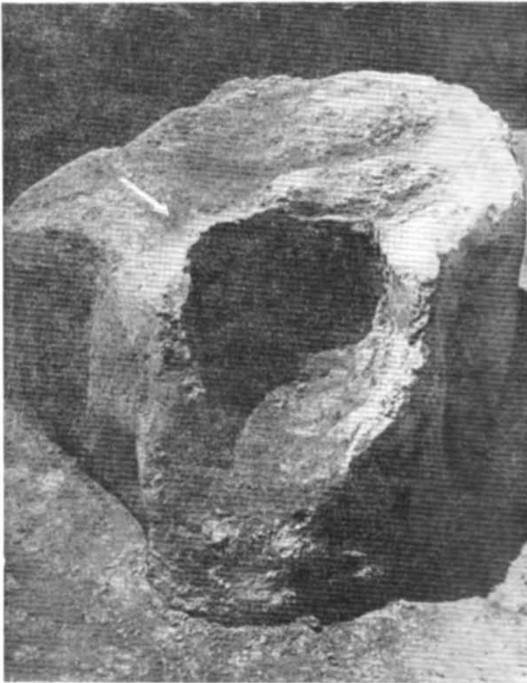
Рис. 3. Горно № 2 з Белгорода Київського.

Привертає увагу керамічне виробництво, оскільки воно є важливим показником для визначення економічного розвитку міста. Про