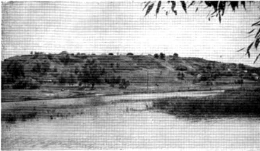
Рис. 1. Загальний вигляд Белгорода.