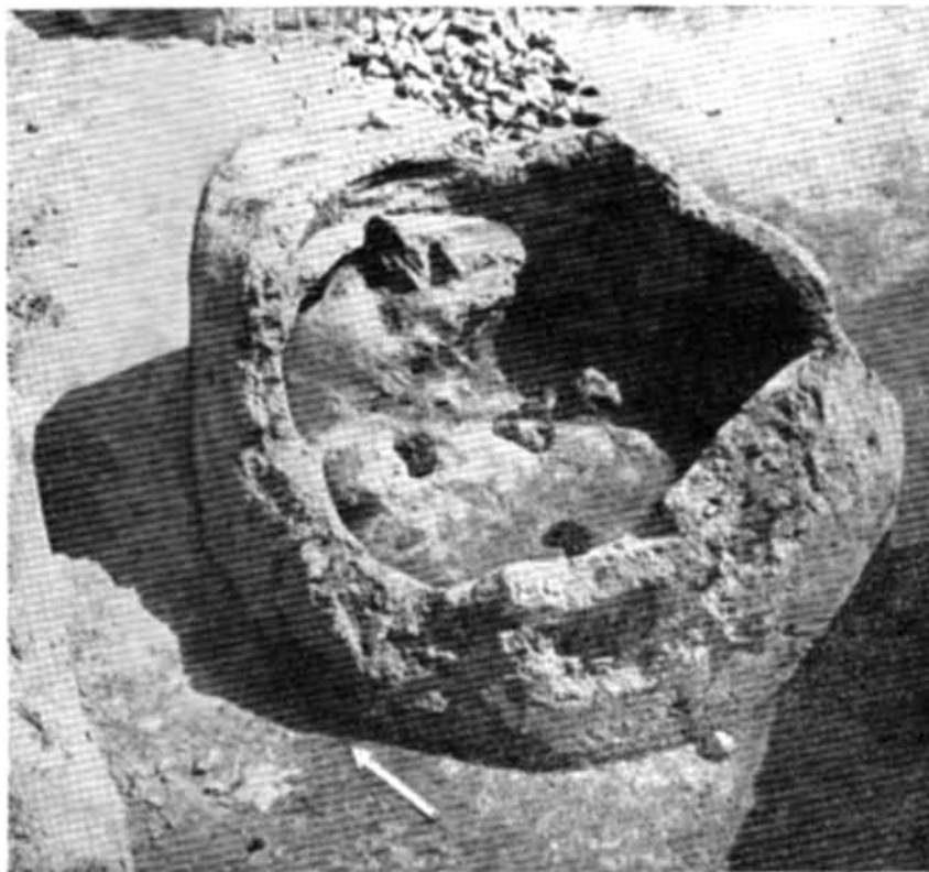
Рис. 2. Горно № 1 з Белгорода Київського.

дяться розкопки на його дитинці і посаді. Виявлено понад 40 стародавніх жител, чимало господарських та виробничих приміщень та безліч різноманітних знахідок. Результати цих досліджень опубліковано у ряді статей 1 .