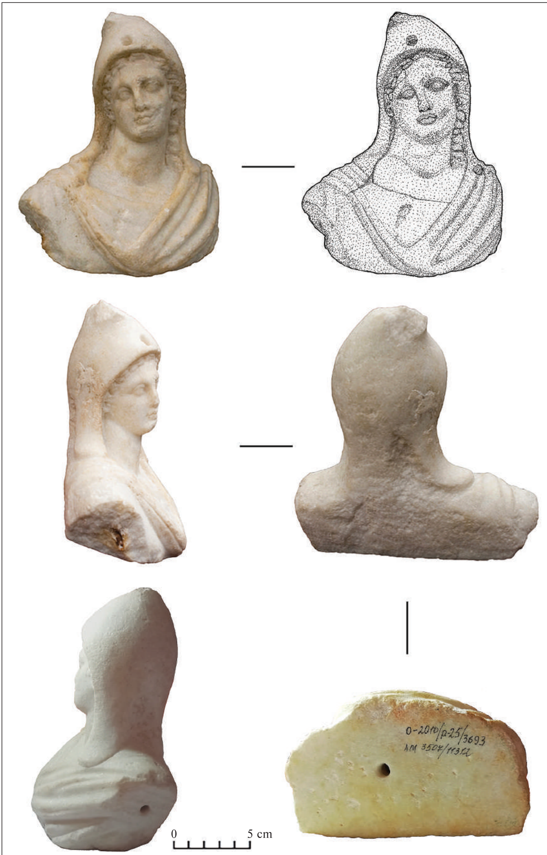
Рис. 2. Мармуровий бюст Мітри-Тавроктон з розкопок ділянки Р-25 в Ольвії (за Р. О. Козленком) Fig. 2. Marble bust of Mithras Tauroctone from excavations at the "R-25" sector in Olbia (after R. O. Kozlenko)