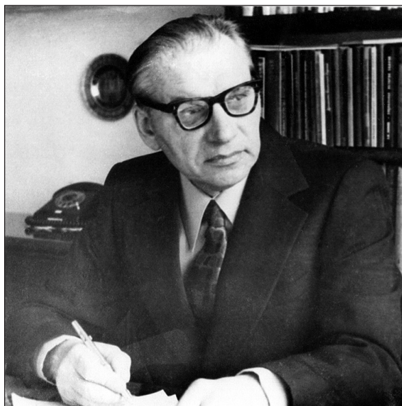
Рис. 1. Борис Андрійович Шрамко у домашньому кабінеті, 1976 р. Харків

Починаючи розвідувальні роботи на Більському городищі у 1954 р., (Шрамко 1955, с. 9—10), він розумів, що для всебічного вивчення такого величезного поселення, необхідні значні зусилля і час та відповідна спрямованість науково-дослідної роботи. А вже через чотири роки, у 1958 р. він керував Скіфослов'янською археологічною експедицією Харківського університету, котру очолював до 1995 р., а з 1992 р. був науковим консультантом спільної Українсько-німецької експедиції ІА НАН України. Отже, все життя Б. А. Шрамка було зосереджене, в першу чергу, на польових археологічних дослідженнях. Саме під час щорічних археологічних розкопок, проведених під його керівництвом на багатьох поселеннях та курганних могильниках різних археологічних періодів та культур на території