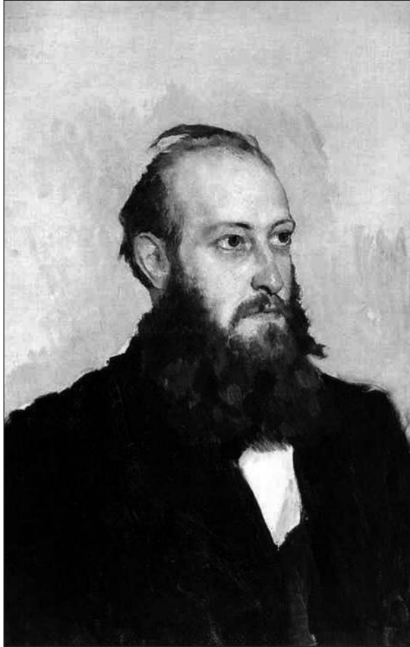
Рис. 3. Портрет В.І. Гошкевича роботи В.М. Васнецова. Державний Російський музей

під керівництвом В.З. Завітневича (Писаренко 1970, с. 119), а наступного року зробив свої перші самостійні археологічні відкриття. Спираючись на археографічні матеріали та проводячи археологічні розвідки, він знайшов руїни замку правителя Києва в 1454—1470 рр. князя Семена Олельковича (1420—1470 рр.) та локалізував літописне місто Городець (Оленковський 2000, с. 7).