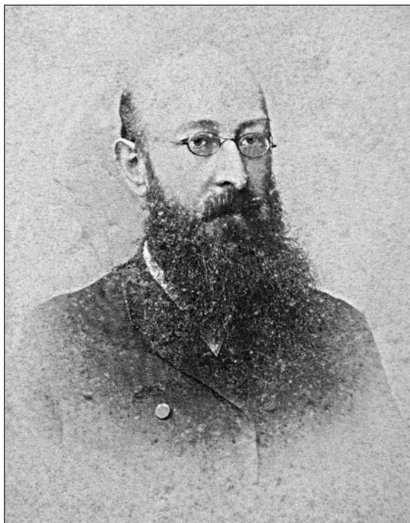
Рис. 6. Віктор Іванович Гошкевич. Фото кінця XIX ст.

Разом з тим, коли кампанія з передання колекцій херсонського Археологічного музею до Одеси зазнала невдачі, саме О.М. Деревницький наполіг на тому, щоб 24 травня 1896 р. В.І. Гошкевича «з уваги до наукової роботи зі збору пам'яток старовини та з огляду на наукову користь, яку може принести його участь у праці Товариства» одноголосно обрали дійсним членом Одеського товариства історії та старожитностей і, таким чином, залучив його до лав найчисельнішої на Півдні наукової спільноти істориків і краєзнавців (Пиворович 2004, с. 101).