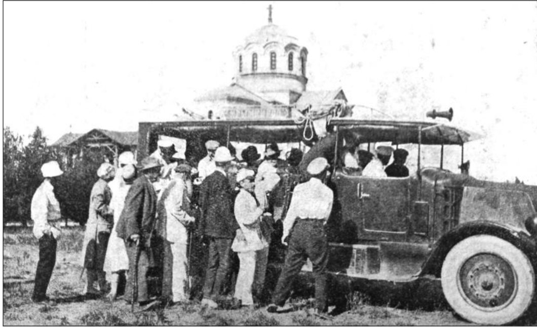
Рис. 7. Делегати конференції сідають в автобус

Впродовж конференції гості могли відвідувати Херсонський музей. У 20-і рр. ХХ ст. розпочалося формування фондів державних музеїв по всьому Радянському Союзу, а в Херсонесі цьому сприяла активність директора музею — історика та археолога К.Е. Гриневича. Однак, аби не применшувати заслуг його попередників, варто коротко зупинитися на житті музею до того.