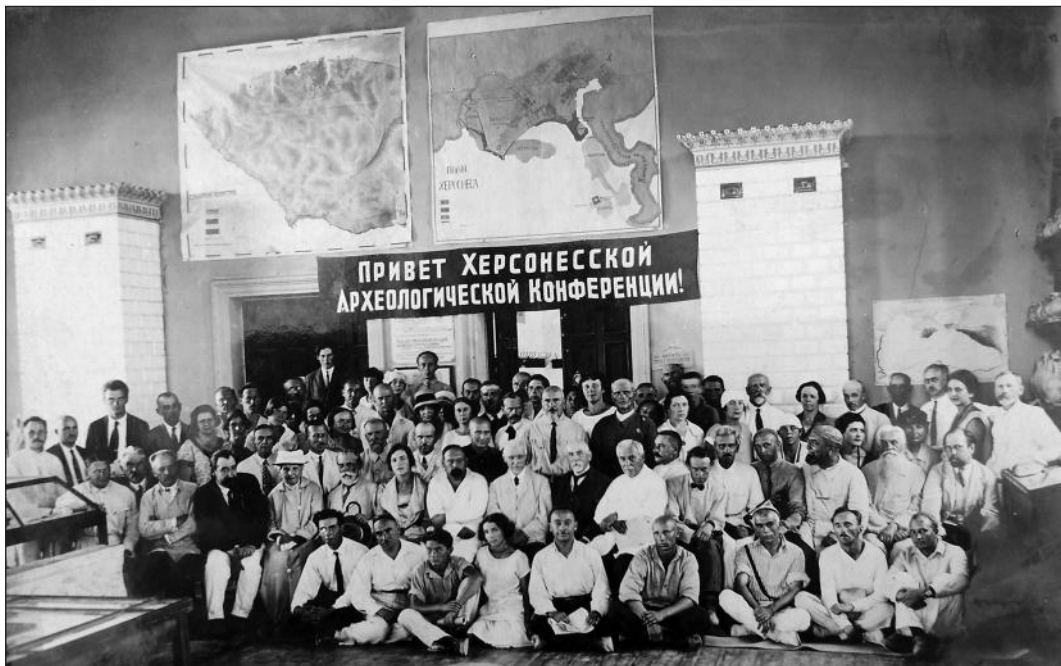
Рис. 2. Делегати Херсонескої конференції

ній. Виділенню доповідей з «тюркської культури» в особливу секцію сприяло як те, що її пам'ятки виходять з хронологічних меж середньовіччя, так і те, що конференція відбулась на кримсько-татарському ґрунті: як вказали проф. І.М. Бороздін та Ф.М. Петров, в цьому були — і реалізація гасла самовизначення народностей, і — в області науково-дослідній — виконання боргу перед тюрко-татарами, так мало вивченими до цих пір.» (Зуммер 2005а, с. 110—111).