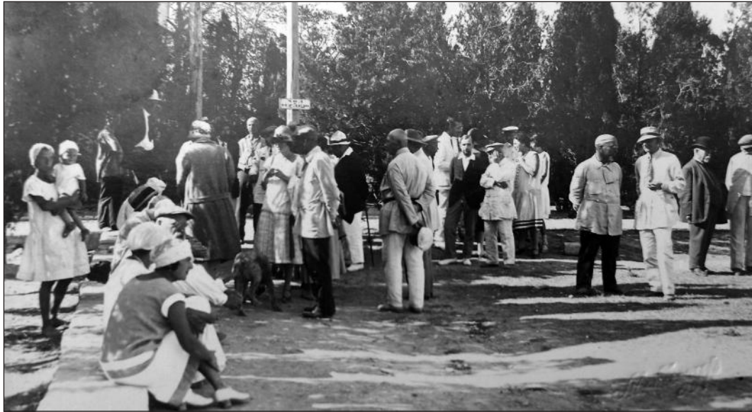
Рис. 1. Група делегатів в очікуванні поїздки в Севастополь