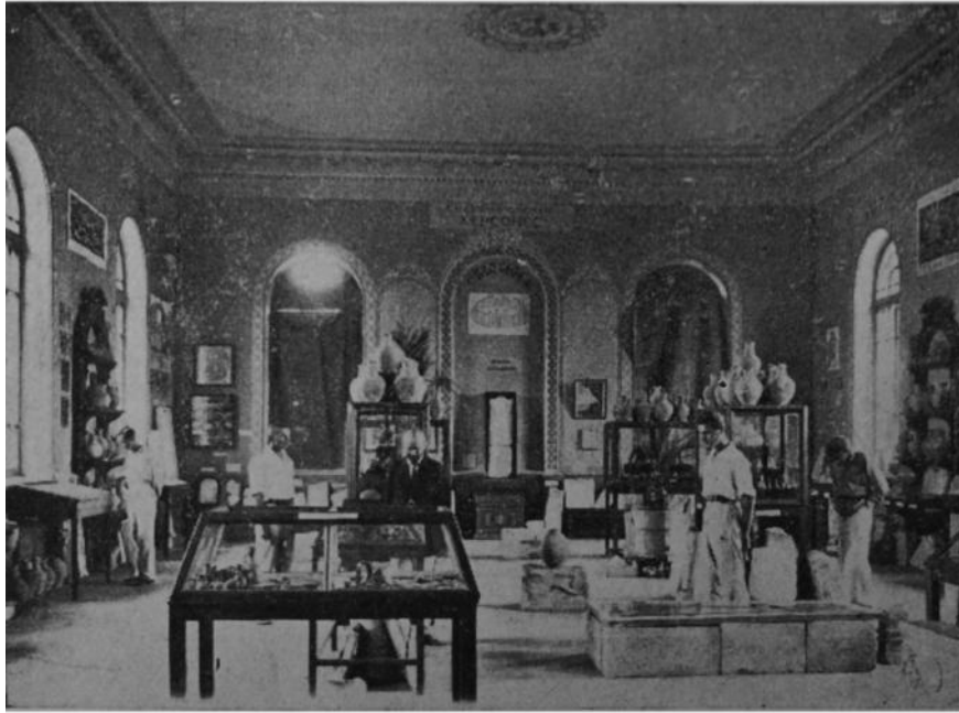
АНТИЧНЫЙ ОТДЕЛ ХЕРСОНЕССКОГО МУЗЕЯ.

Le Musée de Chersonèse Taurique (Crimée). Salle des antiquités grecques et romaines, ouverte en 1925.