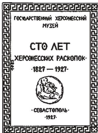
Рис. 5. Обкладинка книжки К.Е. Гриневича «Сто лет херсонесских раскопок (1827—1927)»

Було прийнято такий порядок засідань: робота велася по секціях з 10-ї ранку до 2-ї год. дня, після обідньої перерви — з 5-ї год. дня до 9-ї вечора. Перше урочисте засідання було призначено на 10 вересня, і воно відбулось у залі Міськради о 6-й вечора, разом з партійними, радянськими, професійними та військовими організаціями Криму і Севастополя (там само, с. 6).