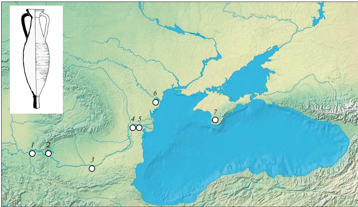
Рис. 2. Карта розповсюдження раннього варіанту амфор типу VIII за А. Опайцем. 1 — Виминачий; 2 — Трандієрна; 3 — Нови; 4 — Троєзміс; 5 — Егісус; 6 — Тіра; 7 — «Совхоз № 10»

лом всередину, останній також профільований неглибоким жолобком. Найбільш близька за формою вінця верхня частина амфори була знайдена в Виминачії (рис. 1, 3), де датується першою половиною II ст. н. е. (Vjelajac 1996, с. 31, sl. VII, 38). Вірогідно, саме до цього часу і відноситься фрагмент, знайдений у Тірі.