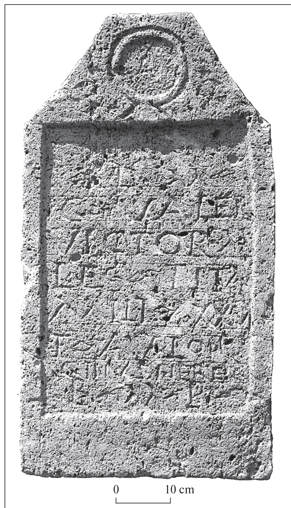
Рис. 1. Надгробок з латинською епітафією, фото (Іванчик 2013)

Переклад: Богам манам. Гай Валерій Віктор. Солдат I Італійського легіону. Прослужив 26 років. Тіт Аврелій Пісцинус, спадкоємець. Поставив тому, хто добре заслужив.