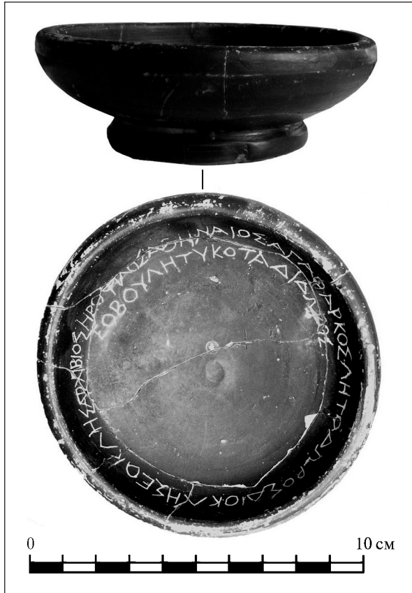
Рис. 1. Ольвія: чорнолакова чашка з графіто всередині

Вказані відмінності пояснюються, зрозуміло, як складністю нанесення напису на внутрішньому боці невеликої чашки, так, мабуть, і характерними особливостями почерку автора, в якому простежуються і раніші — порівняно з відносним датуванням чашки — форми букв. Тією чи іншою мірою близькі за палеографією ольвійські написи на кераміці та свинцевих пластинах (далі просто пластинах) ще без курсивної сигми відносяться в основному до IV ст. до н. е. (наприклад, пор.: Толстой 1953, № 7, 50, 63; Яйленко 1980, с. 80; з літературою: Dubois 1996, р. 63, 72, 120, 171; Тохтасьев 2002, с. 72; Русяева 2010, № 155—158 та ін.).