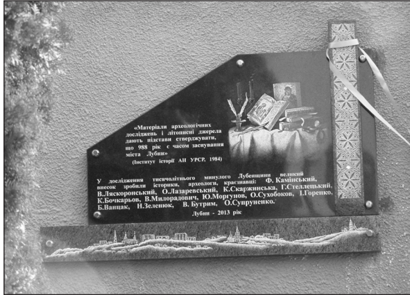
Вигляд меморіальної дошки

писця і вченого давніх часів: ікону Володимирської Божої Матері, добірку стародавніх книг, каламар з двома гусячими перами та свічник з пригаслими свічками. Лівобіч від зображення розміщено напис: «Матеріали археологічних досліджень і літописні джерела дають підстави стверджувати, що 988 рік є часом заснування міста Лубни» . Цитату взято з історичної довідки, підготовленої напередодні відзначення 1000-літнього ювілею міста Інститутом історії АН УРСР (нині Інститут історії України НАН України) у 1984 р.