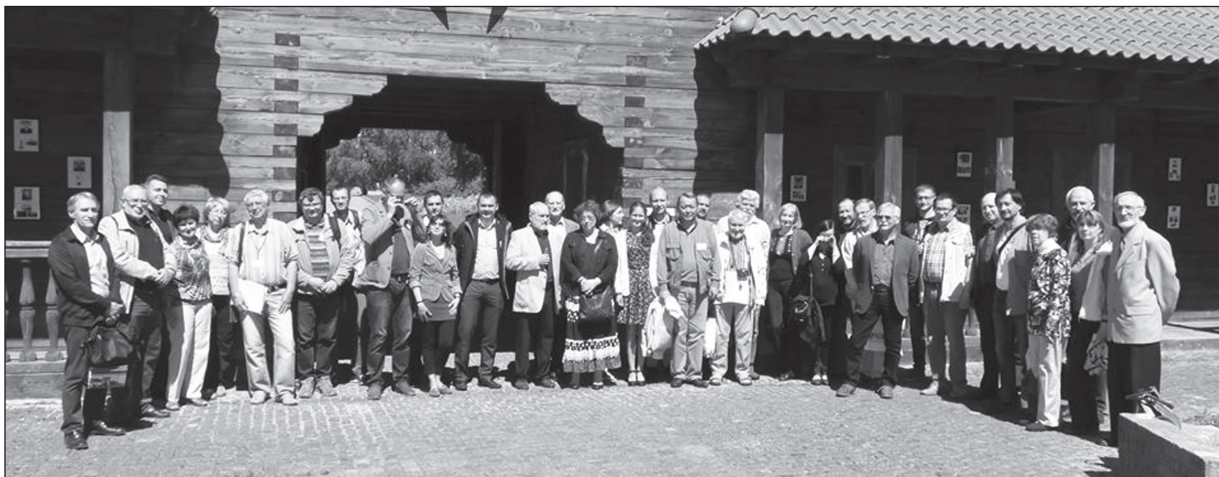
Рис. 1. Учасники Міжнародної археологічної конференції

У 2017 р. виповнюється 110 років від народження видатного вченого, доктора історичних наук, професора, засновника київської школи археології раннього залізного віку Олексія Івановича Тереножкіна. Цій важливій події були присвячені Міжнародна археологічна конференція (м. Чигирин, 21—24 травня 2017 р.) і видання чергової збірки наукових праць «Старожитності раннього залізного віку» в серії «Археологія і давня історія України», що містить публікацію більшості доповідей, які були заявлені на конференцію.