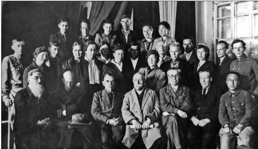
Рис. 5. Серед науковців Ташкенту, 1945 р.

1947 рр.). Однак переїзд в Україну та відірваність від матеріалів змусили призупинити розробку цієї проблематики. Слід підкреслити, що Тереножкін відвідував Самарканд в 1960—1980 рр., проводив невеликі розкопки на Афрасіабі. У січні 1970 р. йому надійшла пропозиція переїхати до Самарканду, щоб очолити кафедру в університеті. Зрештою він відмовився, але у квітні—травні прочитав там курс лекцій та керував археологічною практикою. До ювілею Самарканду були проведені нові розкопки на Афрасіабі, результати яких не суперечили висновкам Олексія Івановича.