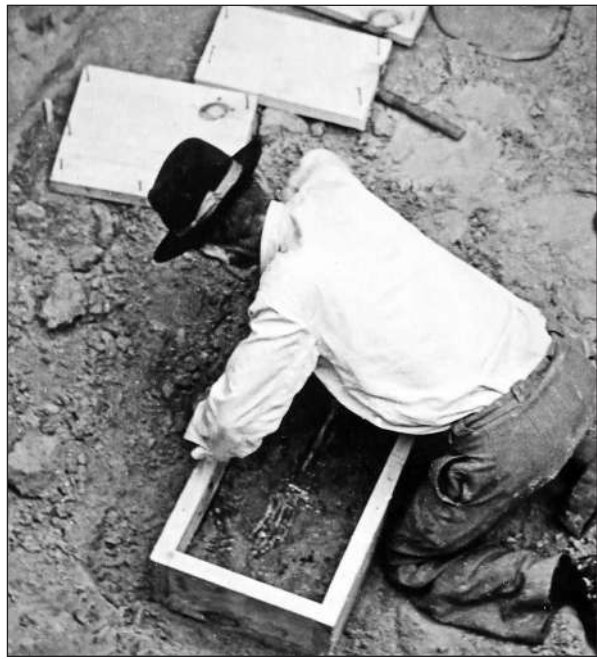
Рис. 7. За виготовленням «монолітів» на Мелітопольському кургані

У Лісостепу до таких, безумовно, відноситься 9-метровий курган з великою поховальною камерою, досліджений у 1949—1950 рр. поблизу с. Глеваха на Київщині. Без урахування досвіду розкопок цієї видатної поховальної пам'ятки, що належала, треба думати, скіфському вождю архаїчного часу, подальші дослідження великих лісостепових курганів навряд чи були б успішними. Ще більшою мірою сказане стосується дослідження в 1954 р. «царського» скіфського кургану у м. Мелітополь. По суті, це були перші розкопки пам'яток подібного рівня після відомих дореволюційних відкриттів М.І. Веселовського. Зрозуміло, що досвід, отриманий під час цих досліджень, важко переоцінити. Саме на розкопках Мелітопольського кургану Олексієм Івановичем була не тільки з'ясована складна структура насипу (фактично, не насипу, а валької архітектурної конструкції), але й застосована уперше в Україні методика дослідження глибоких підземних поховальних споруд з ви-