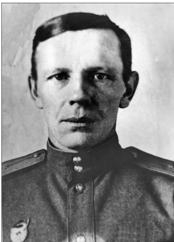
Рис. 4. У роки війни

Через десятиліття М.Є. Массон (1959) заперечував висновок, що в кушанські часи Афрасіаб знаходився в стані занепаду. О.І. Тереножкін же і надалі продовжував наполягати на його помітному відставанні у розвитку в порівнянні з південними областями, а причину бачив у сарматських навалах. Крім того, розбіжності були і в трактуванні пізньосередньовічних нашарувань (Тереножкін 1972).