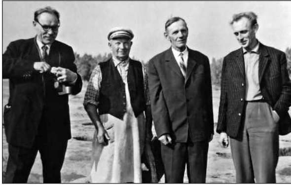
Рис. 8. У відрядженні до Чехословачини

ної, катакомбної, зрубної культур на р. Молочній (1951—1952), де загалом було досліджено понад 500 поховань. При цьому були внесені серйозні поправки в атрибуцію та хронологію деяких категорій пам'яток. Так, наприклад, О.І. Тереножкін довів, що кам'яні антропоморфні статуї, які відносили раніше до витворів кіммерійців, насправді належать населенню ямної культури. Саме в результаті розкопок на р. Молочній були досліджені великі сарматські могильники, які склали ґрунтовну джерельну базу для вирішення питань сарматської проблеми в Україні.