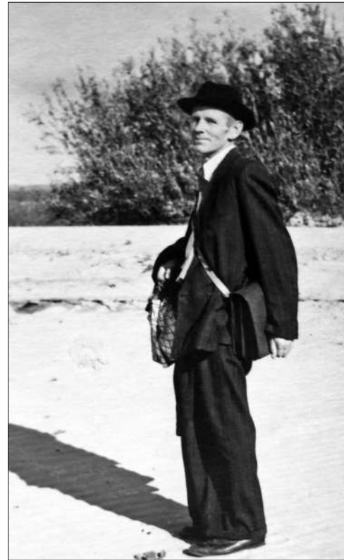
Рис. 9. Розвідки у вихідні

У колективі відділу археології раннього залізного віку Інституту археології НАН України плідно працюють вже учні його учнів та їх послідовники. При цьому проблематика, що розробляється фахівцями відділу, багато у чому знаходиться в межах тих наукових орієнтирів, які свого часу дуже проникливо намічені були на майбутнє Олексієм Івановичем Тереножкіним.