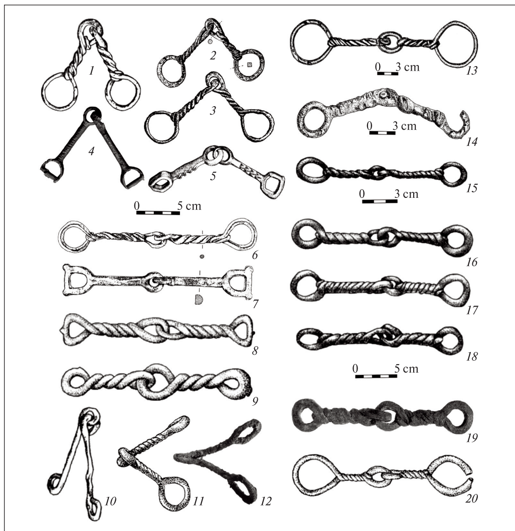
Рис. 2. Удила: 1 — Малый курган в Мильско-Карабахской степи; 2 — Калакент, погребение 47; 3 — Дивалона в Ленкорани; 4 — курган 524 у с. Жаботин; 5 — курган 23 могильника Сакар-чага 6; 6–7 — погребение с конем в Норшунтепе; 8–9 — Богемия, Центральная Европа; 10 — Келермесс, погребение 27; 11 — Кармир-блур; 12 — Хасанлу IV; 13–14 — Мингечаур, курган II; 15 — Anadolu Dedeniyetleri Müzesi, Ankara (раскопки Adilcevaz); 16 — Elazığ Müzesi; 17–18 — Adana Bölge Müzesi; 19 — Хасанлу IV; 20 — Шамхорский могильник, Шемкир. 6–12, 19–20 — не в масштабе. 1–3, 13–14, 20 — Азербайджан; 4 — Черкасская область, Украина; 5 — Дашогузский район, Туркменистан; 6–7, 15–18 — Турция; 8–9 — Чехия; 10 — Адыгея, Россия; 12, 19 — Западно-Азербайджанский остан, Иран (1 — по: Иессен 1965, рис. 10; 2 — по: Nagel, Strommenger 1999, tabl. 19, 6.2640d; 3 — по: Mahmudov, Kəsmənlı 1974, tabl II, 7; 4 — по: Рябкова 2014, рис. IV.1, 3; 5 — по: Яблонский 1996, рис. 18, 3; 6, 7 — по: Hauptmann 1983, Abb. 4, 5, 6; 8–9 — по: Медведская 2013, рис. 4, 9–10; 10 — по: Галанина 1997, рис. 4, 10; 11 — по: Медведская 2013, рис. 4, 11; 12 — по: Schauensee, Dyson 1983, fig. 12; 13–14 — по: Асланов и др. 1959, табл. XXXIX, 2, 4; 15–18 — по: Yıldırım 1987, Şek. 42–44; 19 — по: Schauensee 1989, fig. 11; 20 — по: Асланов 1986, рис. 14)

письменных источниках о скифах (Зенобий 1948, с. 291). В изголовье многих погребенных находились один или два железных наконечника копья, а у правого или левого виска — по одной серьге, или же бронзовые втульчатые наконечники стрел скифского типа, некоторые из них — архаические двухлопастные с ромбическим пером (Асланов 1986, с. 4, рис. 13). В двух погребениях Шамхорского могильника были