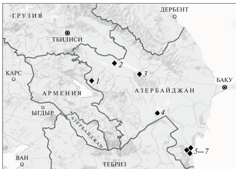
Рис. 1. Карта распространения удил и псалиев: 1 — Калакент, каменный ящик 47; 2 — Шемкир, Шамхорский могильник; 3 — Мингечаурский курган II; 4 — Малый курган; 5 — Дивалона; 6—7 — Узунтепе и Балабур. 1—5 — трехдырчатые псалии; 1—7 — удила с витыми стержнями

2) изготовлением из витого стержня. Как правило, удила этого типа встречаются в одном комплекте с бронзовыми не скрепленными трехдырчатыми псалиями.