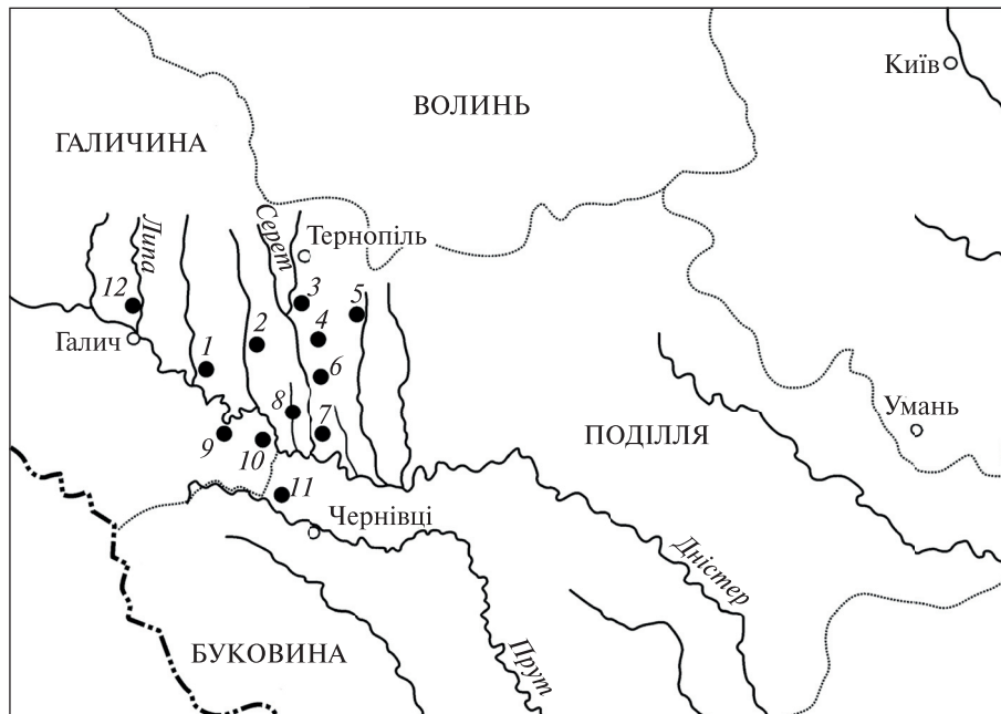
Рис. 1. Карта-схема пам'яток трипільської культури, відкритих та частково вивчених у кінці XIX — початку XX ст. у Верхньому Подністров'ї (за Childe 1923): 1 — Коропець; 2 — Бучач; 3 — Трємбовля (з 1944 р. Терєбовля); 4 — Копичинці; 5 — Васильківці; 6 — Вигнанка; 7 — Більче-Золоте; 8 — Кошилівці; 9 — Незвисько; 10 — Городниця; 11 — Шипинці; 12 — Езуполь

кераміка різних культур. До першого комплексу входять розписні келихи з добре відмученої глини, аналогії яким відомі на трипільсько-кукутенських поселеннях етапу ВІІ (Незвисько, Бодаки, Коновка, Тростянчик, Ворошилівка та ін.). Другий комплекс кераміки автори схильні датувати жешувською фазою малицької культури, що одночасно існувала з Трипільля-Кукутені етапу ВІІ на цій території (Позіховський, Самолюк 2008, с. 39). Археологічні артефакти могильника дозволяють повному охарактеризувати склад давньоенеолітичного населення Волині й особливо його контакти з сусідніми племенами. У цьому плані цікавими є пам'ятки Середнього Побужжя (Тростянчик, Ворошилівка) звідки, імовірно, надходили розписні келихи на Волинь. Зрозумілішими стають шляхи проникнення імпорту та впливів волино-люблінської культури на керамічні комплекси трипільських пам'яток Буго-Дніпровського межиріччя (Онопріївка, Веселий Кут). Важливі матеріали могильника і для розуміння характеру зв'язків населення Волині та коломийщенської групи пам'яток Трипільля, де під впливом волино-люблінської культури з'являється сіролощена кераміка (Гребені, Юшки та ін.). Імпортна чорнолощена посудина малицької культури, виявлена серед комплексу знахідок київського святилища та вище згадане, можливо, може свідчити