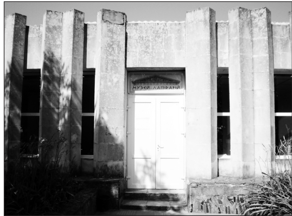
Рис. 3. Музей-лапідарій, Національний історико-археологічний заповідник «Ольвія»

Третій снаряд (№ 194) було виявлено археологічною експедицією під керівництвом