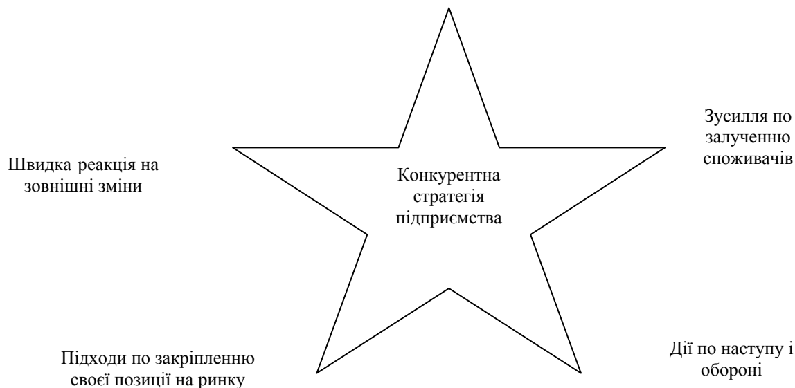
Рис. 1. Склад конкурентної стратегії (М. Портер)

Запропоновані Майклом Портером у книзі «Стратегія конкуренції», яка була видана в 1980 році, загальні конкурентні стратегії сьогодні претендують на деяку універсальність, оскільки практика довела високу їхню ефективність.