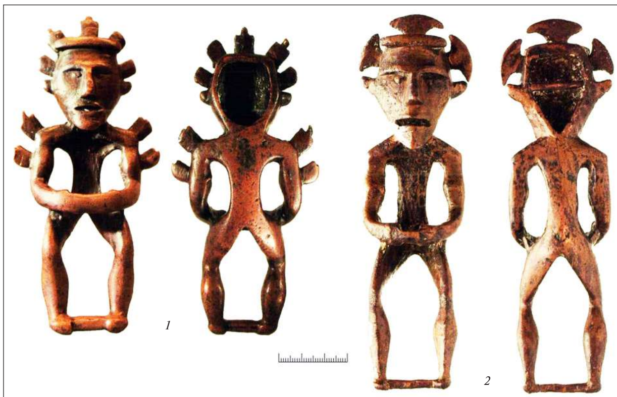
Рис. 4. Бронзові ідоли Галічського (Туровського) скарбу (за: Студзицкая, Кузьминых 2013)

Загадковою лишається безголовість торсів-бюстів. Їх виявлено вже 15 у 14-ти похованнях ДДБК (Литвиненко 2018, с. 164, рис. 5: 2). Нагадую, що брак голови помічено й на фігурці з Кевюд. З якоїсь причини бабинці, а часом і лолінці, уникали моделювання голови. Певне пояснення тут надає етнографія. Довідник