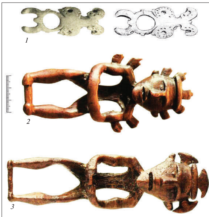
Рис. 5. Антропозооморфні пряжки в горизонтальній (робочій) проекції: 1 — Чограй VIII; 2—3 — Галіцький скарб