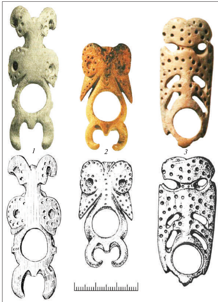
Рис. 2. Антрополозооморфні кістяні пряжки Лолінської культури: 1 — Чограй VIII, кург. 34, пох. 1; 2 — Кевюди 1, кург. 3, пох. 5; 3 — Терта 1, кург. 2, пох. 7 (за: Мимоход, 2013)