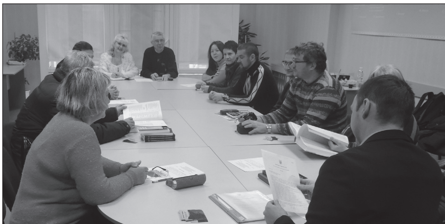
Рис. 1. Засідання координаційної ради з питань наукового вивчення Більського городища. Котельва, березень 2016 р.

Для науковців, пов'язаних з історією вивчення одного з найбільших та найвідоміших укріплень скіфської епохи на теренах Лівобережної України — Більського городища — поточний рік став знаменним двома подіями. Виповнюється 110 років від початку його археологічного дослідження та 95 років від дня народження патріарха лівобережної школи археології Бориса Андрійовича Шрамка. Цей видатний вчений, професор Харківського національного університету ім. В.Н. Каразіна, близько 40 років життя присвятив видатній пам'ятці та ототожнював Більське городище з містом Гелоном.