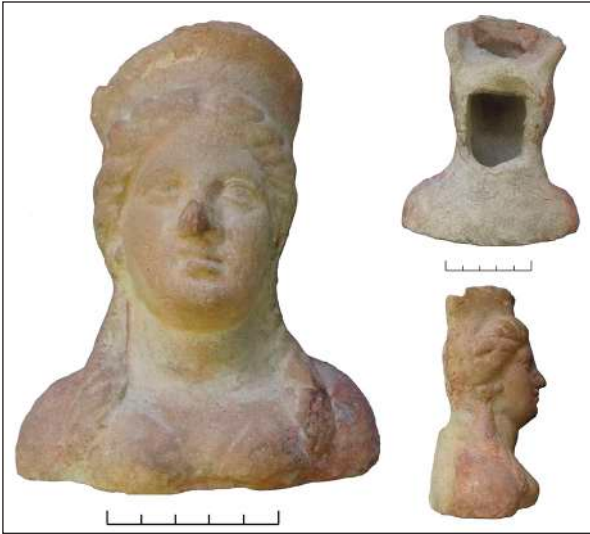
Рис. 7. Погруддя богині в полосі Fig. 7. Bust of a goddess wearing the polos