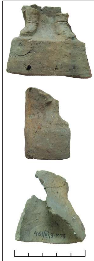
Рис. 8. Нижня частина фігурки чоловіка Fig. 8. The lower part of a male depiction

Ерот з тімпаном, звичним для Матері богів інструментом, зображений біля Афродіти на теракотах, одна з яких зберігається в Британському музеї, інша — в Наукових фондах