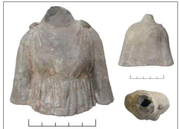
Рис. 5. Фрагментована півфігура жінки з ліпними прикрасами Fig. 5. Fragmented semifigure of a woman with handmade decorations