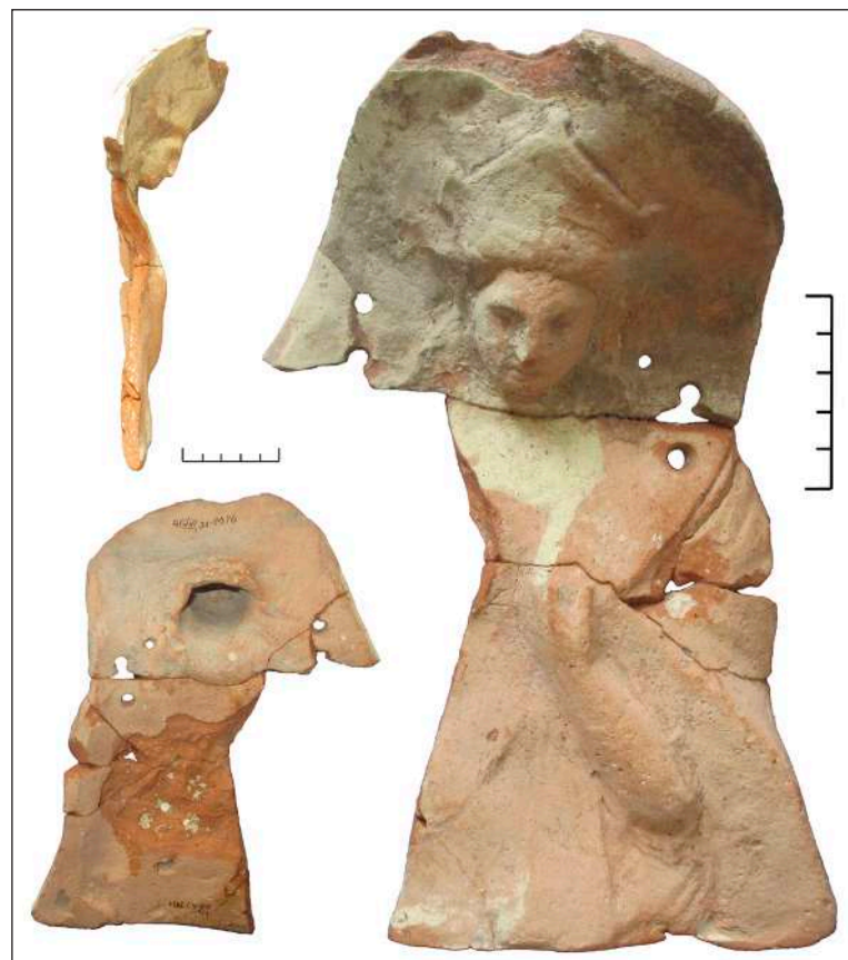
Рис. 6. Фрагментована протома зі слідами ремонту Fig. 6. Fragmented protome with traces of reparation