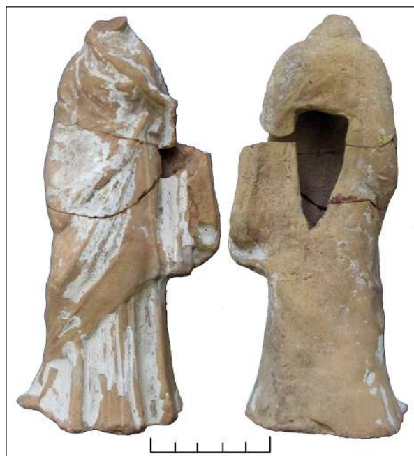
Рис. 3. Фрагментована фігурка танаського типу Fig. 3. Fragmented statuette of Tanagra type