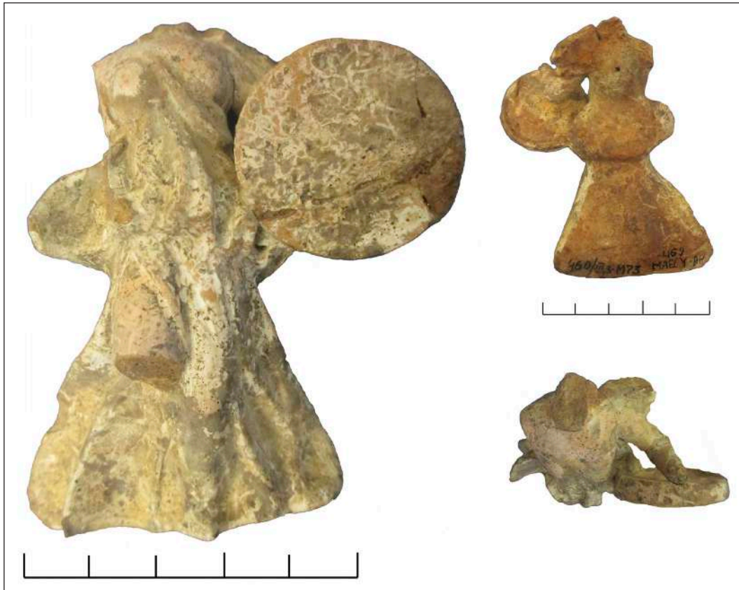
Рис. 1. Фрагментована фігурка Ніки Fig. 1. Fragmented statuette of Nike