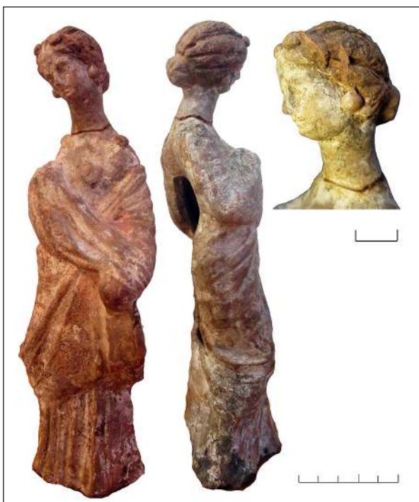
Рис. 2. Зображення танаського типу жінки у плющовому вінку Fig. 2. Tanagra type image of a woman wearing an ivy wreath