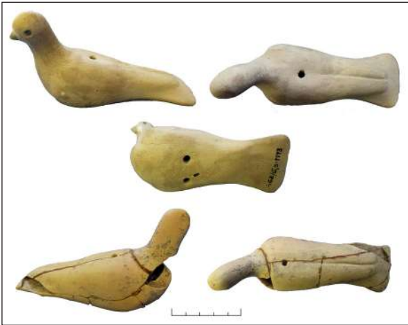
Рис. 9. Підвісні фігурки голубів Fig. 9. Hanging figures of doves

ченко Т. 2011, с. 204—205 з літ.). Ерот Танатос — у головному уборі, незвичному для зображень еротів, але властивому зображенням Матері богів. Ероти біля Афродіти зазвичай представлені без головних уборів, як і сама богиня. Є винятки, зокрема монументальна мармурова скульптура з Пергаму II ст. до н. е., де висока стефана Афродіти нагадує полос (Musée de Pergame 1994, р. 2—3). Фігурки Еротів Танатосів у значній кількості знайдено в ботросі Центрального Теменоса Ольвії, де найбільш численні були зображення Матері богів.