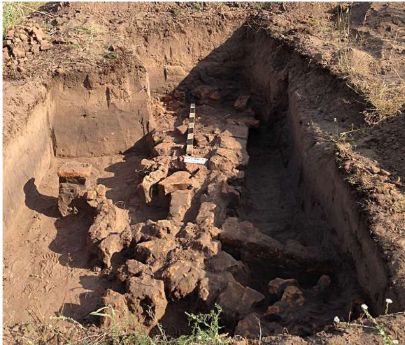
Рис. 5. Огринь 8 — 2018. Мусульманське поховання XV ст. під закладкою з плінфи

горі, яке переросло в селище VIII—IX ст. з оборонними валами. На основі останнього формувалися найдавніші міські структури верхнього міста княжого Києва X ст., безперервний розвиток якого простежується до нашого часу.