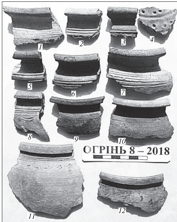
Рис. 4. Огринь 8 — 2018: 1—10 — вінчики посуду XI—XIII ст.; 11, 12 — вінчики посуду кінця XI ст.

східніше, зупинялися на кілька днів перед першим Кодацьким порогом, у Передпоріжжі, тобто поблизу гирла Самари. Судна готували до подолання небезпечних порогів, поповнювали припаси, шукали досвідченого лоцмана, очікували сприятливої погоди тощо. Існують вагомі підстави стверджувати, що з гирла Самари починалася переправа через Дніпро вище Кодацького порогу. На користь цього свідчать рештки давньоруських поселень на ключових пунктах такої переправи — Огринь, острів Каменеватий (Князів) та Лоцманська Кам'янка на правому березі Дніпра (рис. 1).