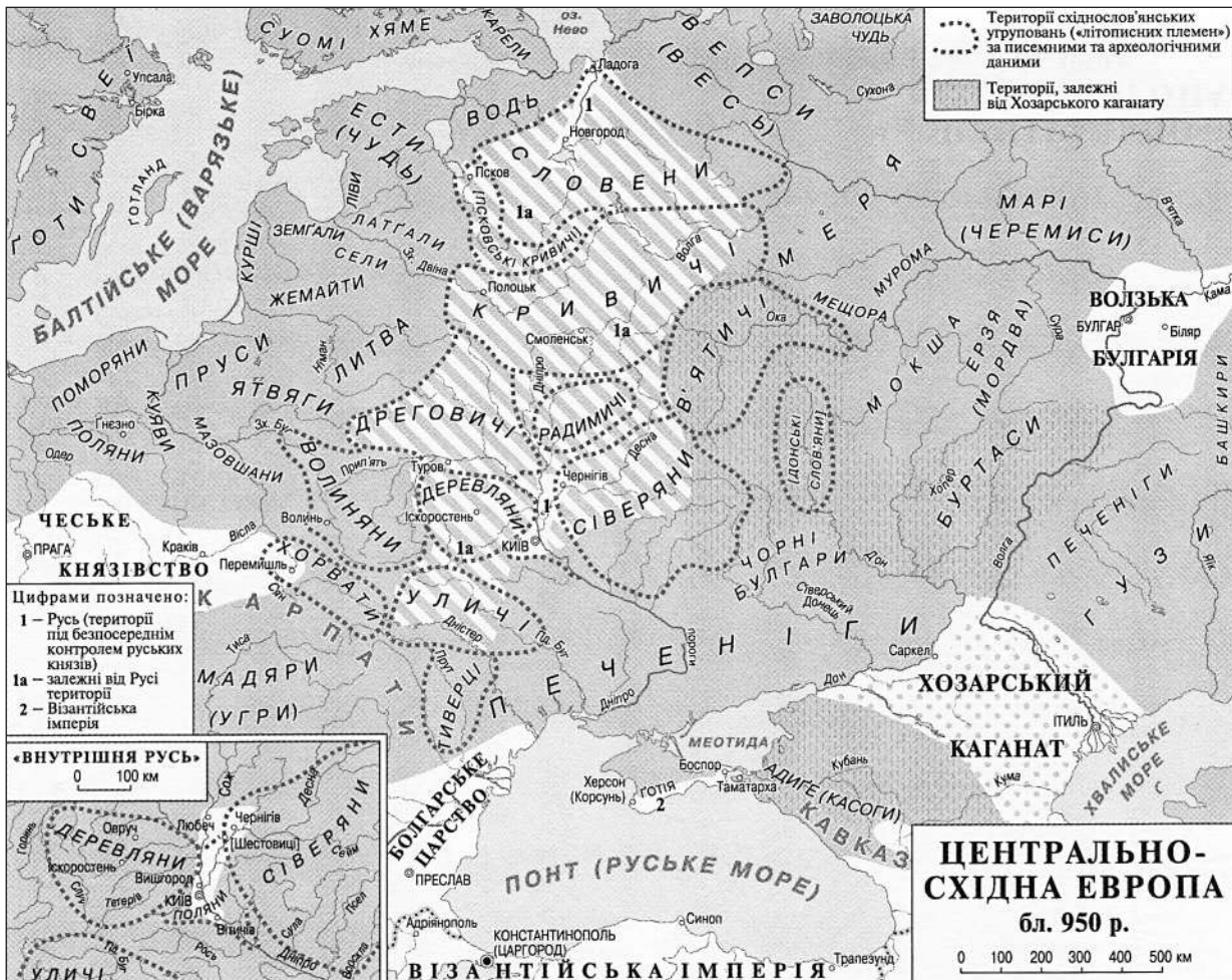
Рис. 1. Центральна-Східна Європа близько 950 р. (за: Плохій 2015)

Тож поява версії «національної одноруськості» східних слов'ян стала не моментальним «кремлівським озорінням», а пояснюється змінами у часто підсвідомому розумінні власного місця в історії вчорашнього «старшого брата». Та цьому слід протиставити не реальну боротьбу в окопах (хоча, на превеликий жаль, якраз це стало об'єктивною реальністю. Й підтверджується дійсним станом речей вже протягом кількох років), а науково обгрунтованою аргументацією. Звичайно, у одній роботі це зробити теоретично й практично неможливо. Тож в даному випадку зупинимося лише на сучасному баченні підоснови процесу викристалізації та виокремлення предків сучасних східнослов'янських народів використовуючи, в першу чергу, досягнення археології.