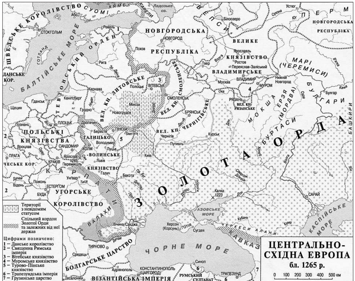
Рис. 3. Центрально-Східна Європа близько 1265 р. (за: Плохій 2015)

а формування нових етносів відбувалося вже у нових історичних умовах (рис. 3).