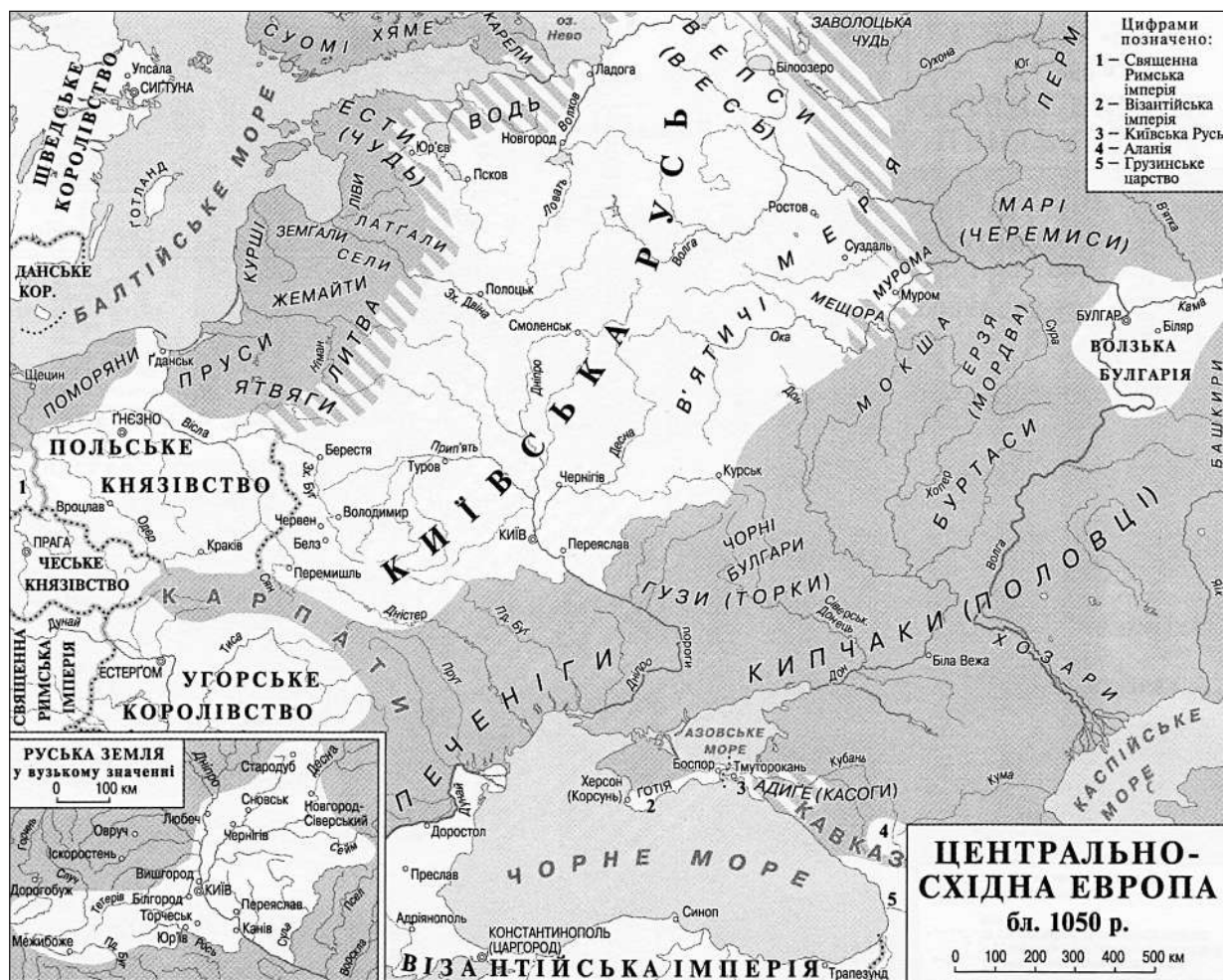
Рис. 2. Центрально-Східна Європа близько 1050 р. (за: Плохій 2015)

Список міст, котрі згадані у повідомленні про «закликання варягів» — Ладога, Новгород, Ізборськ, Білоозеро, а також у дещо пізнішій літописній статті — Полоцьк, Ростов, Муром, на думку Г. Лебедева, означає початкові межі «Верхньої» (тобто «Зовнішньої») Русі, на основі котрої пізніше склалися Новгородська та Псковська землі, а в X ст. виділилася Ростово–Суздальська (Лебедев 1985, с. 197). Але вищенаведена думка про пізнішу вставку стосовно Ростова дозволяє окреслювати кордони «Зовнішньої Русі» дещо південніше Мурому й трохи північніше Смоленська й Полоцька (рис. 2).