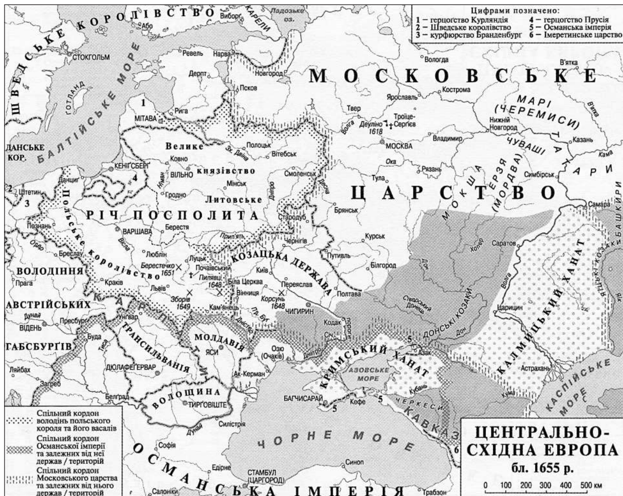
Рис. 5. Центрально-Східна Європа близько 1665 р. (за: Плохій 2015)

ідею про «єдиний народ» на просторах Східної Європи, але навіть ставили під сумнів саме існування як цілісної етнічної одиниці самого народу російського (рис. 5). Наведемо на підтвердження цього конкретні приклади.