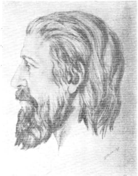
Рис. 2. Портрет похованого в гробниці біля с. Іванне. Відтворення за черепом зроблено Г. В. Лебединською.

8. Янтарна підвіска — амулет у вигляді округлого лінзовидного в поперечному розрізі диска з округлим просвердленим отвором у центрі. Предмет фрагментований (розламаний надвоє, немає приблизно \frac{1}{3} частини диска). На одному боці підвіски — солярний знак у вигляді хреста, сторони якого утворюють чотири рядки невеликих округлих заглиблень; на другому вигравіруване схематичне зображення трьох людських фігур з піднятими догори руками. Перша постать, найбільша за розміром, має підкреслені ознаки чоловічої статі; поруч з нею зображені лук і стріли. Лук, типу простих, уміщено вертикально, паралельно до першої людської фігури, якій він майже відповідає за своїм розміром. Дві стріли, зазначені короткими скісними нарізами, розміщені між правою,