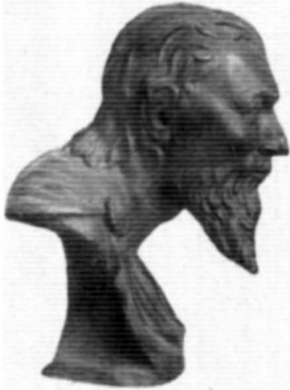
Рис. 3. Скіф з центрального поховання у мавзолеї Неаполя скіфського. Реконструкція М. М. Герасимова.

Коли абстрагуватися від таких спільних рис, як довге волосся і бороди, то з усіх перелічених П. М. Шульцем ознак залишається лише одна — «орлиний ніс» 23 . Дійсно, легко встановити, що овал обличчя на монетах ширший, нижня щелепа більш розвинена; на рельєфі, в свою чергу, знаходимо не такий опуклий лоб, як на одному з штемелів, і не такий низький, як на іншому (рис. 2). Нарешті, не можна ігнорувати й різницю у трактуванні головного убору, що її помітив ще П. Й. Бурачков 24 .