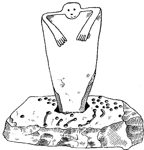
Рис. 3. Реконструкція жертовника зі стелою з кургану поблизу с. Ближне-Бойового.

Нарешті, в Криму відомі кемі-обинські кургани, під насипами яких збереглися поламани основи стел, що стояли вертикально. В одному випадку така основа стояла у спеціально вирубаному в скелі прямокутному отворі. З боків вона заклинювалася дрібним камінням. У зв'язку з цим слід нагадати, що, як зазначає А. Хейслер, основа однієї з белогрудівських стел була поламана так,