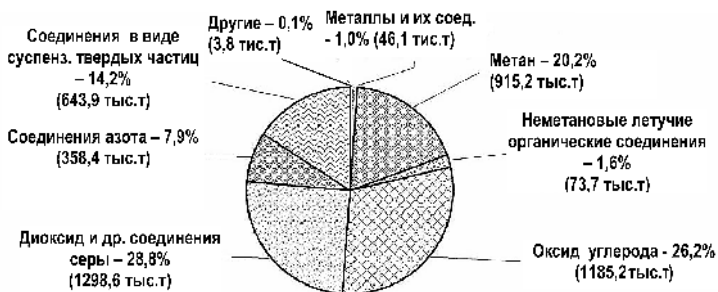
Рис. 1. Структура выбросов вредных веществ в атмосферу от стационарных источников загрязнения за 2008 г. [11]

ществ, поступивших в атмосферу, выбросы метана и оксида азота, которые относятся к парниковым газам, составляют соответственно 648,3 и 3,6 тыс. т. Кроме этих веществ, в атмосферу за 2009 г. было выброшено 105,2 млн т диоксида углерода, который также оказывает влияние на изменение климата [12]. Эту ситуацию можно изменить только за счет экологизации деятельности предприятий [10].