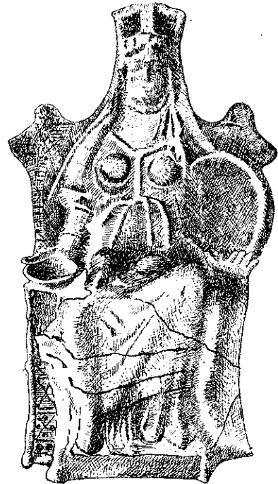
Рис. 2. Теракотове зображення Кібели.